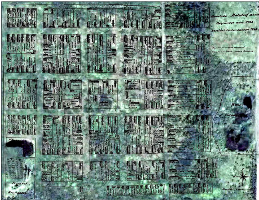
Слика 6: Мапа Молина