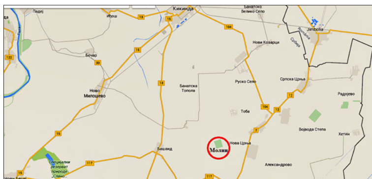
Слика 1. Положај Молина у односу на околна насеља

Положај Молина није био повољан. Због неизграђене путне мреже саобраћај са околним насељима се одвијао споро и уз тешкоће. Молин се налазио у пространој