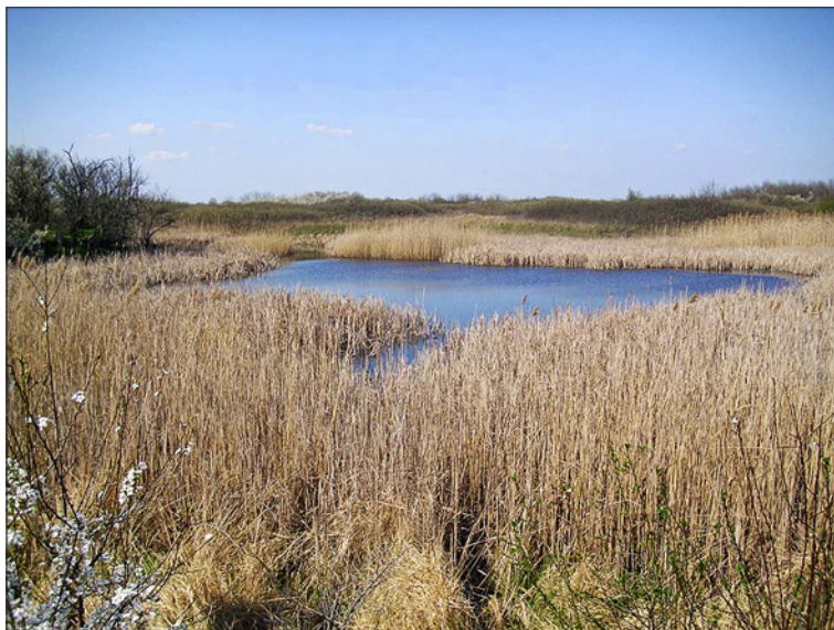
Слика 3: Бара на подручју Молина

Просечна годишња сума падавина на овом простору је 565,6 mm. У периоду од 1949. до 1963. године највећа сума падавина је била 759,0 mm, а забележена је 1955. године. Најмање падавина је било 1961. године (420,0 mm). Средњи годишњи број дана са падањем снега износи 24,3. Највећа учесталост дана са падањем снега била је управо катастрофалне 1956. година, укупно 46 дана.