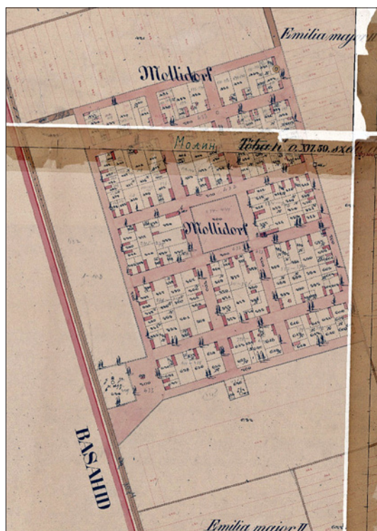
Слика 5: План насеља Молина

Данас приликом шетње шумом, дуж утврђених стаза, могу се видети цигле које су обрасле травом, али и различити бетонски остаци некадашњих грађевина.