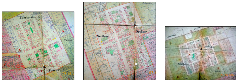
Слике 2, 3, 4. План села Шарлевил (лево), Солтур (средина) и Сент Хуберт (десно) 1875. година

На основу доступних података, примећује се да се број становника у сва три села повећавао. Највећи број становника забележен је у Светом Хуберту, 1.426 становника. Од првих пописа са краја 18. века па до друге половине 19. века управо је у Светом Хуберту забележен највећи пораст становника. Највећи пораст становника у Светом Хуберту је забележен 1821. године када се за непуних 30 година