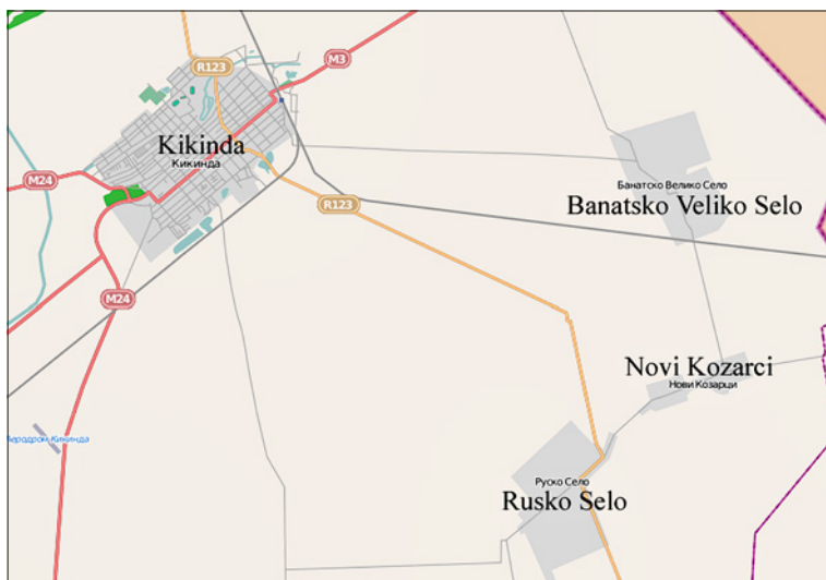
Карта 1. Положај Банатског Великог Села у односу на Кикинду, размер 1:200000