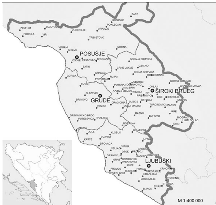
Karta 1. Geografski položaj i teritorijalna pokrivenost Zapadnohercegovačke županije unutar Bosne i Hercegovine odnosno Federacije Bosne i Hercegovine; Izvor: Prostorna osnova opštine Grude u Prostorni plan opštine Grude za period 2009. do 2028. godine. (2012)

Što se prirodno-geografskih karakteristika tiče, Županija se nalazi na području kojega obeležavaju plodne doline, ali i visoki planinski masivi: Čvrnsnica, Čabulja, Zavelim, Lib i Kušanovac. Najviša među njima je Čvrnsnica s vrhom Pločno koji se nalazi na 2228 m nadmorske visine. Područje Županije karakteriše i velika vertikalna raščlanjenost, s obzirom da je reč o području koji se nalazi na nadmorskim visinama koje se kreću u rasponu od 60 do čak 2 228 m. Skladno tome, Županija pripada dvema geografskim celinama, a reč je o Niskoj Hercegovini i Visokoj Hercegovini, kojoj pripada gotovo čitav severni deo Županije (Prostorni plan Županije Zapadnohercegovačke za period od 2008. do 2028. godine, 2012).