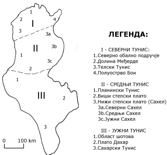
Карта 1. Географске регије Туниса

Издвајањем физичкогеографских регија и њиховим поређењем са антропогеографским регијама дошло се до сазнања где се ове две регионализације највише „подударaju“, те су издвојене географске регије Туниса: Северни Тунис (чине га северно обално подручје, долина Међерде, Телски Тунис и полуострво Бон), Средњи Тунис (који чине планински Тунис са Џебел Шамбијем, виши степски плато и нижи степски плато - Сахел) и Јужни Тунис (у којем се издвајају област шотова, плато Дахар и Сахарски Тунис) (Давидовић, 1999).