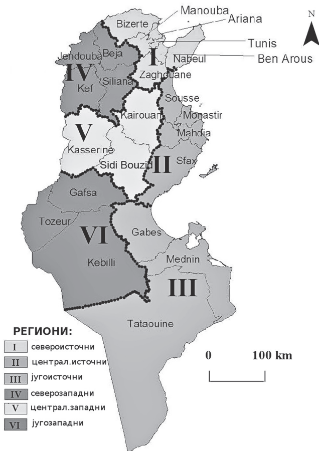
Карта 2. Региони и гувернорати у Тунису