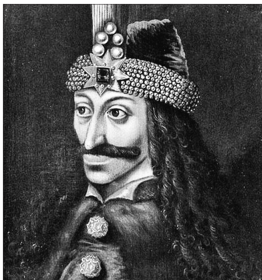
Слика 1. Влад III Дракулеа