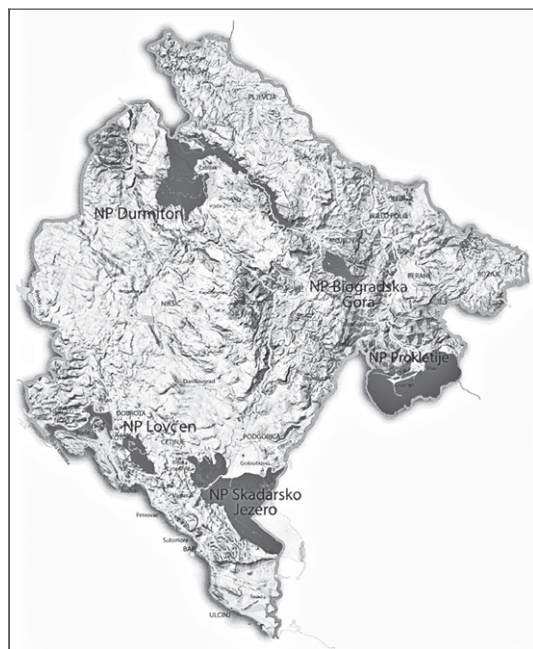
Карта 1. Географски положај НП Дурмитор у границама Црне Горе (Р 1:950.000)

риторији пет општина – Жабљак, Пљевља, Плужине, Шавник и Мојковац (Љешевић, Стијеповић, 1996; Ристановић, Мркша, 2007; www.nparkovi.me ).