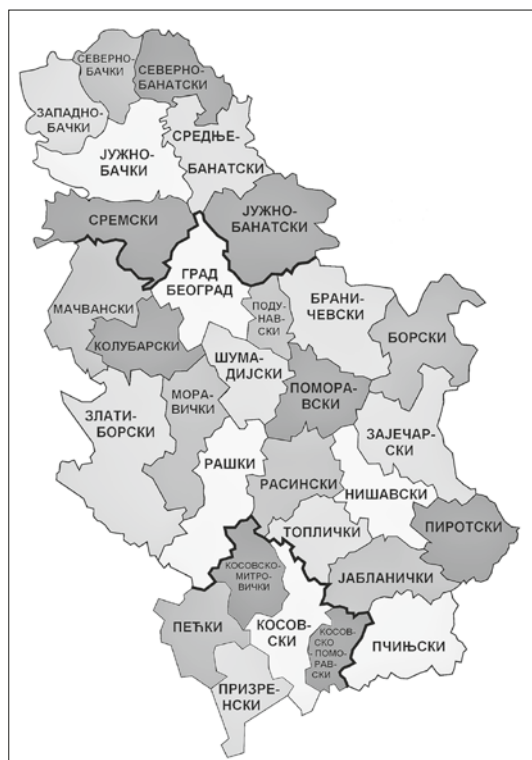
Карта 2. Мапа Србије по окрузима

Простор Јужне Србије се налази у средини јужног Балкана, смештен између Бивше Југословенске Републике Македоније (БЈРМ) на југу, Пиротског округа на истоку, Расинског, Поморавског и Зајечарског округа на северу, и Косовско-