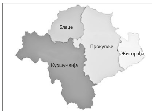
Карта 4. Топлички округ

Од историјских споменика треба споменути Хисар, брдо изнад Прокупља, које представља симбол града. Ту су откривени делови средњовековне тврђаве са још добро очуваном кулом коју народ зове Југ-Богданова, по једном од јунака Косов-