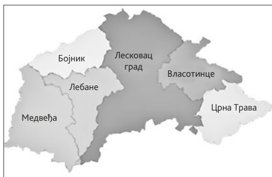
Карта 5. Јабланички округ