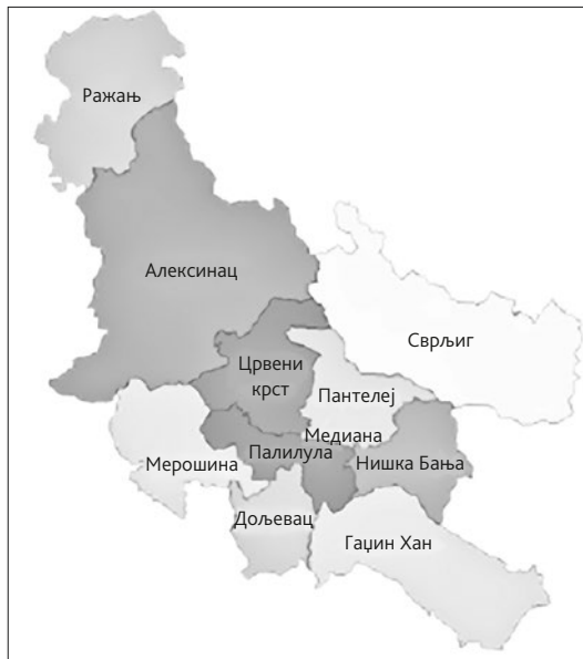
Карта 3. Нишавски округ

У самом граду Нишу налази се Нишка тврђава, која се убраја међу најлепше и најбоље очуване тврђаве на Балкану, а зидана је крајем XVII века. На периферији Ниша је спомен-обележје Ђеле-кула, кога су Турци сазидали од лобања и гла-