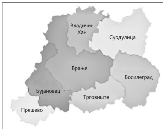
Карта 6. Пчињски округ