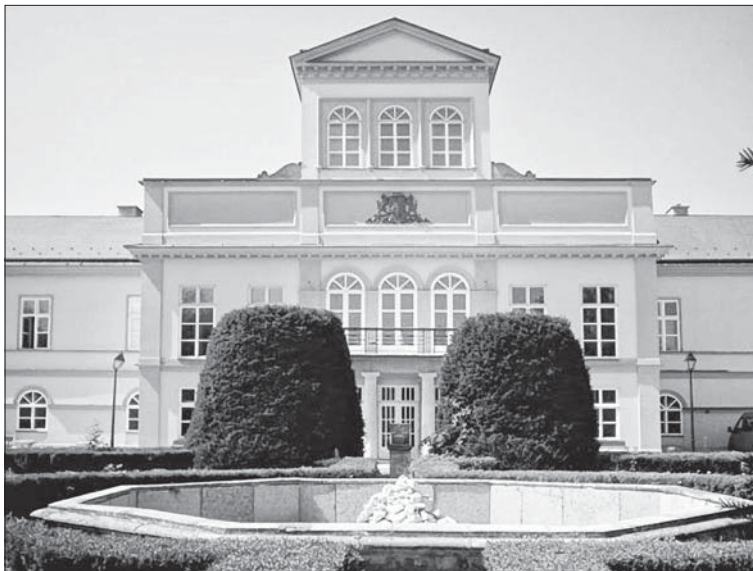
Слика 1. Замак у Паларикову