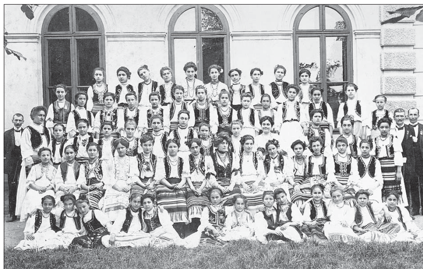
Сл. 1. Ученице Више српске девојачке школе у Новом Саду, јун 1907.