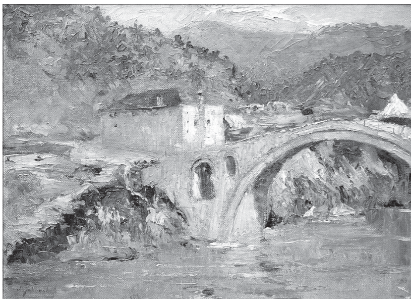
Сл. 9. Мотив из Србије (Мост код Љум куле) (1913), уље на картону, 25 x 34,3 цм, потписано доле десно: Д. Јовановић, приватно власништво