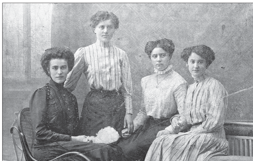
Сл. 2. У Београду са пријатељицама, 30. јун 1909.