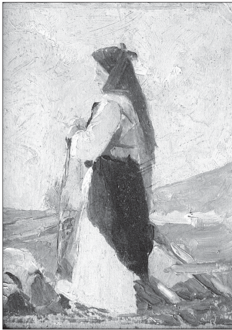
Сл. 6. Чобаница (1913), уље на картону, 17 x 12,7 цм, приватно власништво

Fig. 6 Shepherdess (1913), oil on canvass, 17 x 12,7 cm, private collection