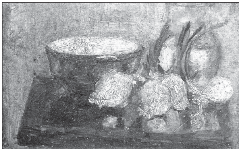
Сл. 10. Мртва природа (1914), уље на картону, 56,8 x 39,4 цм, Легат Ангелине и Милана Груловића, Бешка