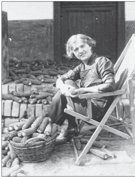
Сл. 4. Лето у Бешки, 1913. Fig. 4 Summer in Beška, 1913