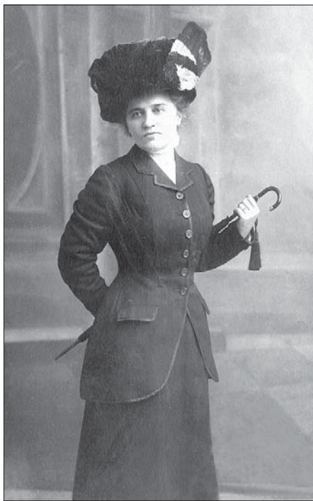
Сл. 5. Из атељеа „Оберполлингер“, Минхен 1914. Fig. 5 From Oberpollinger studio, Munich, 1914

бра. Даље ме питате колико ми времена и година осим ове треба да се усавршим у овој милој ми и драгој вештини?! На ово питање тешко је дати тачан одговор, јер је сликарство така уметност која има мање грана него свака наука, али јој је корен дубљи него у науке. Овим хоћу да кажем – колико година имамо да студирамо, што више праксе, што више година студирати, то боље”, писаће она у априлу 1912. године из Минхена.