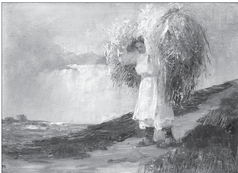
Сл. 8. Сељак са нарамком сена (1913), уље на платну каширано на картон, 24 x 34 цм, потписано лево доле иницијалима: ДЈ, запис на полеђини: 1488 Г, приватно власништво Fig. 8 Peasant with a bale of hay (1913), oil on canvass on cardboard, 24 x 34 cm, signed in the lower left corner with initials: DJ, note on the back: 1488 G, private collection

вић, после дугог низа година одсуства вратила у Бешку и донела својим сликама добробит месту у којем је рођена.