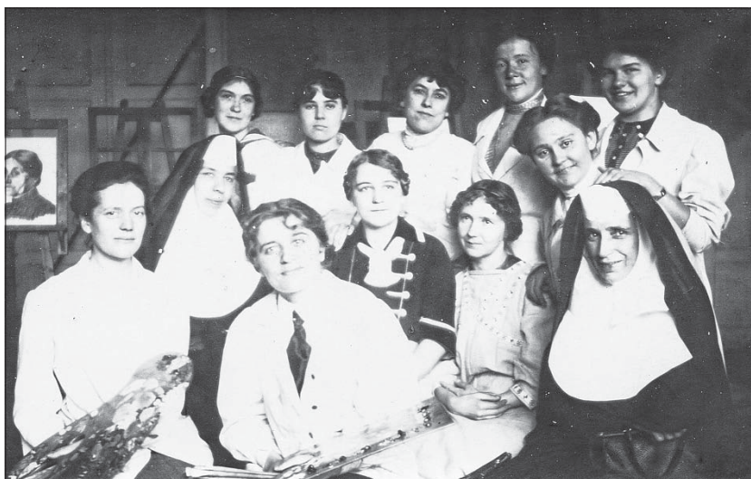
Сл. 3. Женска сликарска академија у Минхен, 1913.