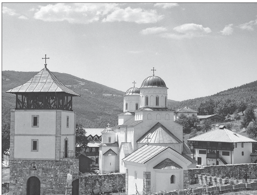
Слика 3. Манастир Милешева