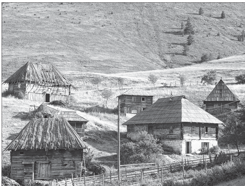
Слика 4. Село Милаковићи