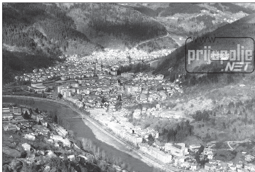
Сл. 1. Центар града Пријепоља Fig. 1 Centre of the town Prijepolja