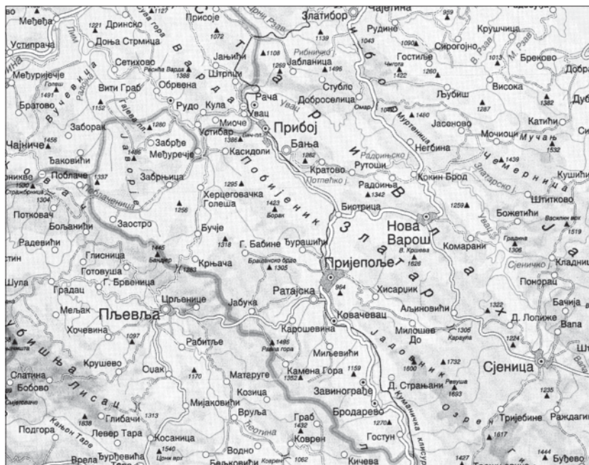
Карта 1. Положај Пријепоља у југозападној Србији