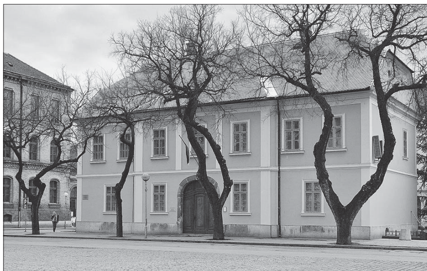
Сл. 8. Галерија “Милан Коњовић”, Сомбор