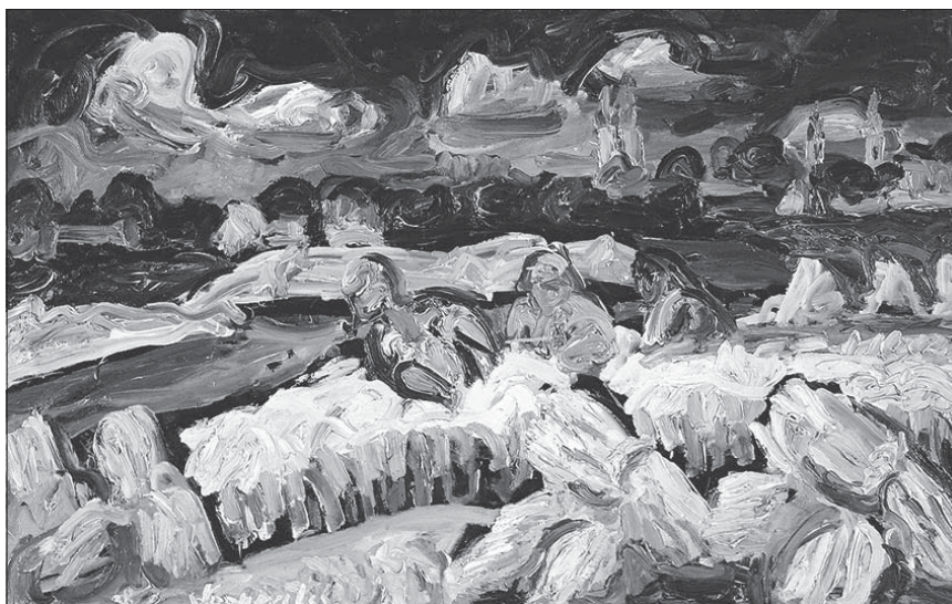
Сл. 10. Милан Коњовић, Жетва (Спомен-збирка Павла Бељанског, Нови Сад)