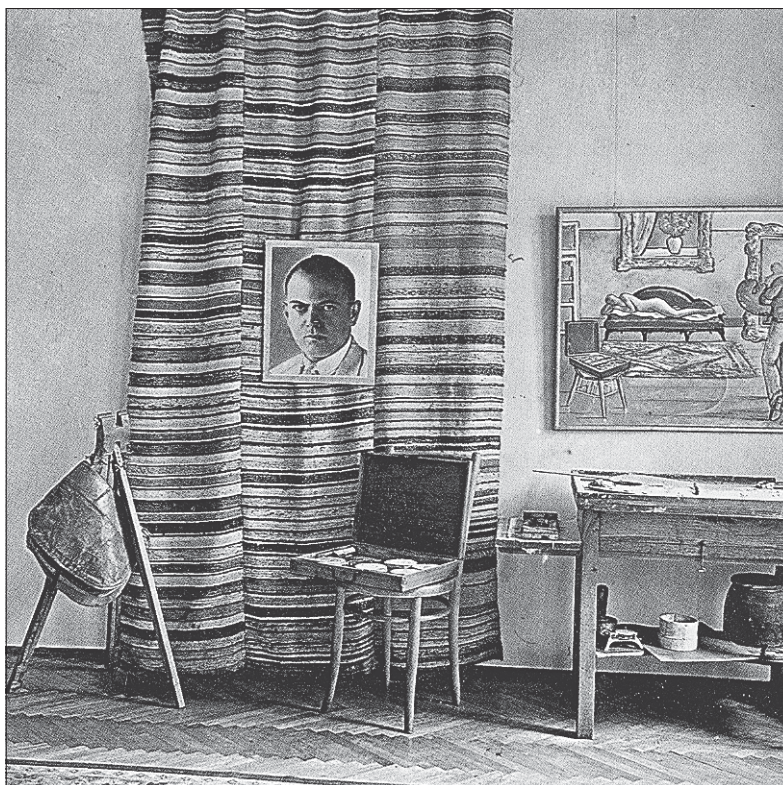
Сл. 2. Реконструкција атељеа Саве Шумановића у галерији у Шиду Fig. 2. Reconstruction studio of Sava Šumanović in Šid's gallery