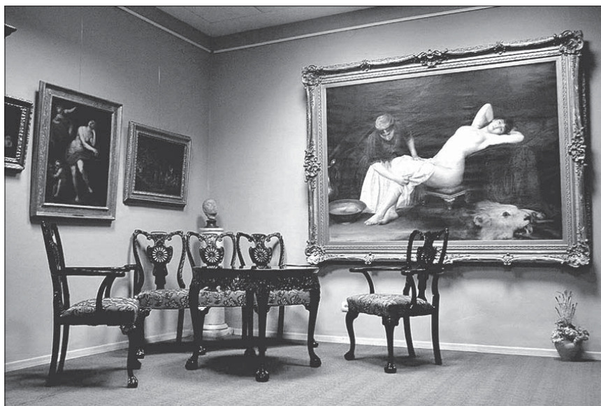
Сл. 7. Спомен-збирка Павла Бељанског у Новом Саду, стална поставка