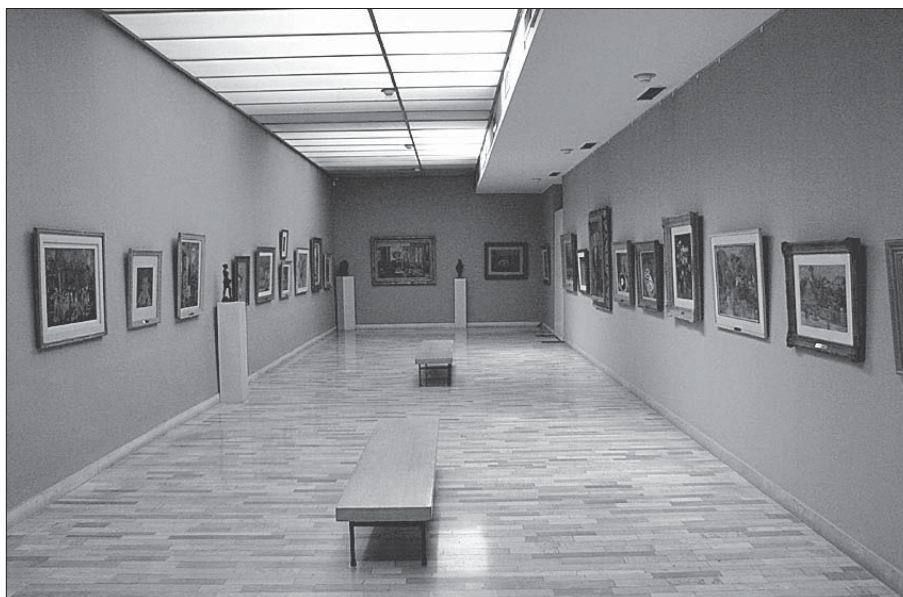
Сл. 6. Спомен-збирка Павла Бељанског у Новом Саду, стална поставка