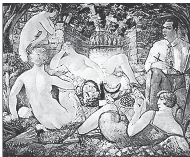
Сл. 3. Сава Шумановић, Доручак на трави (Спомен-збирка Павла Бељанског, Нови Сад) Fig. 3: Sava Šumanović, Breakfast on the grass (Memorial - collection by Pavle Beljanski, Novi Sad)