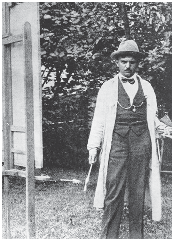
Сл. 1. Сава Шумановић