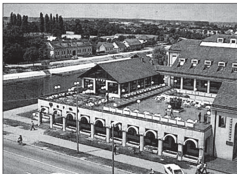
Слика 2. Пословни центар “Терме”