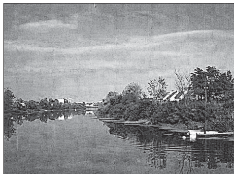
Слика 1. Панорама Босути

Тече упоредо са Савом. Изразито је равничарска река. Храни се највећим делом водом из издани, а мањим делом од малих потока који се сливају са источних падина Диља и Крндије и са лесних заравни на северној страни. Готово да се не запажа развође између Посавине (слива Босути) и Дравско-Дунавске низије (слива Вуке). Босут је необичан по много чему. То је река која нема прави извор, а ушће јој је код села Босут у Срему, западно од Сремске Митровице. То је река са великим бројем меандара, чак десет већих, и са честим променама смера. Проток воде и стање водостаја регулише се са две бране које се налазе у рубној зони града. Винковци су једини град, који се са још четрнаест села (четири су у СЦГ, а остала у Хрватској) развио уз ову необичну и занимљиву реку. Босут се не користи за пловидбу. Његове воде се не користе за водо-