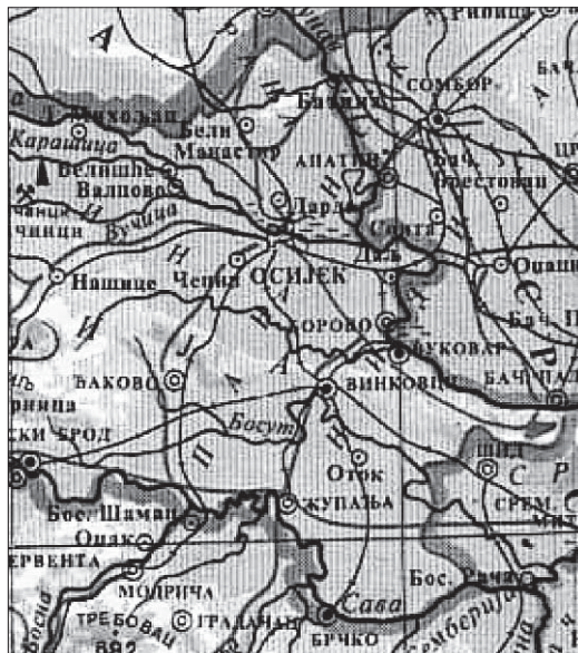
Карта 1. Положај Винковаца у источној Хрватској

која спаја наведене делове Европе са Јадранским морем и Средоземљем. Град је такође са овим туристичким центрима повезан и железницом, а представља и најкраћу железничку везу између Београда и Хрватског приморја (596 km). Винковци су иначе познати као велико железничко чвориште од кога се рачвају железничке пруге на све стране бивше Југославије, а самим тим и Европе. Недалеко од града на важним путним и железничким комуникацијама удаљености од 30 до 40 km налази се неколико државних и међународних граничних прелаза: Жупаља-Орашје и Гуња-Брчко на Сави, према Босни и Херцеговини, Липовац-Бајаково, Товарник-Шид и Илок-Бачка Паланка на Дунаву, према Србији и Црној Гори.