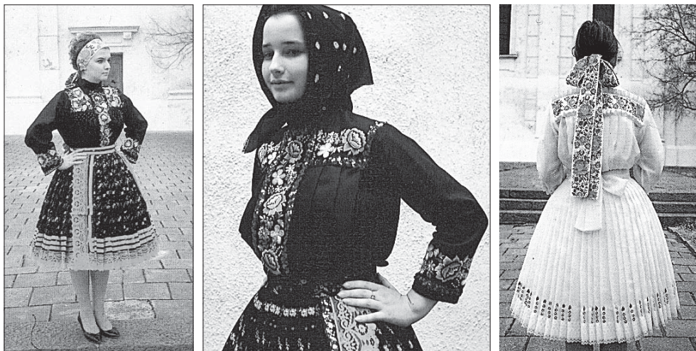
Слике 1, 2 и 3. Различити украси на женској словачкој ношњи Photos 1, 2, and 3. Different ornaments at Slovakian's female costume