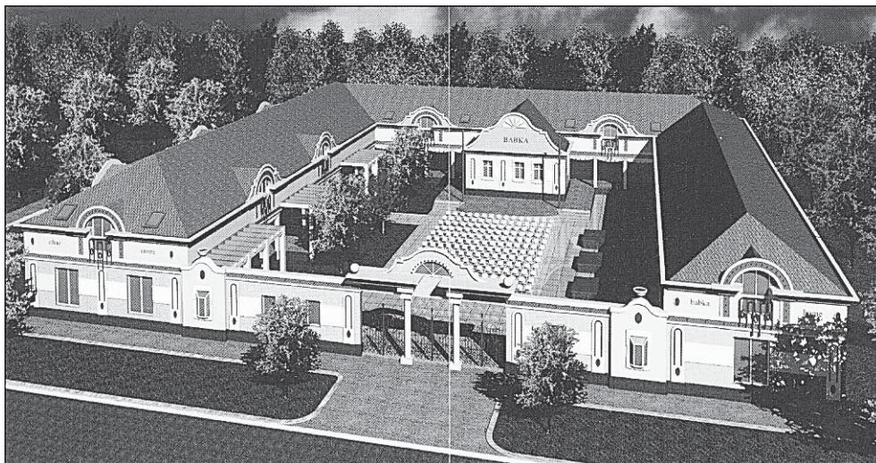
Слика 4. Идејни пројекат будућег “Етно центра” у Ковачици