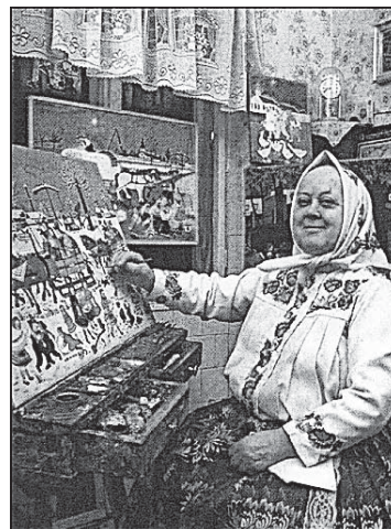
Слике 5 и 6. Чувена Зузана Халупова и једно од њених дела