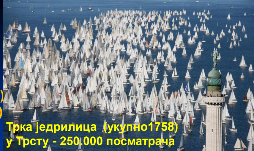
Трка једрилица (укупно 1758) у Трсту - 250.000 посматрача