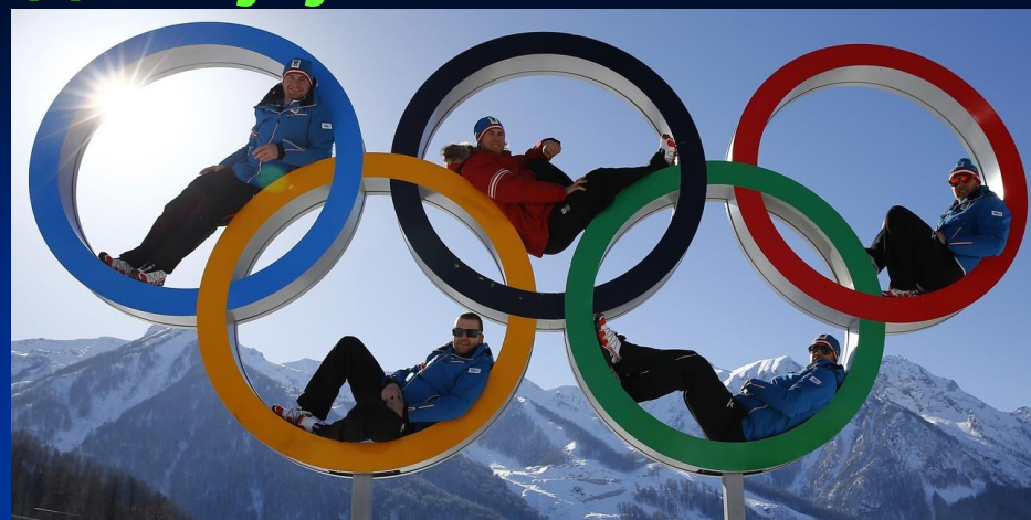
Мале Олимпијске игре у Панчеву