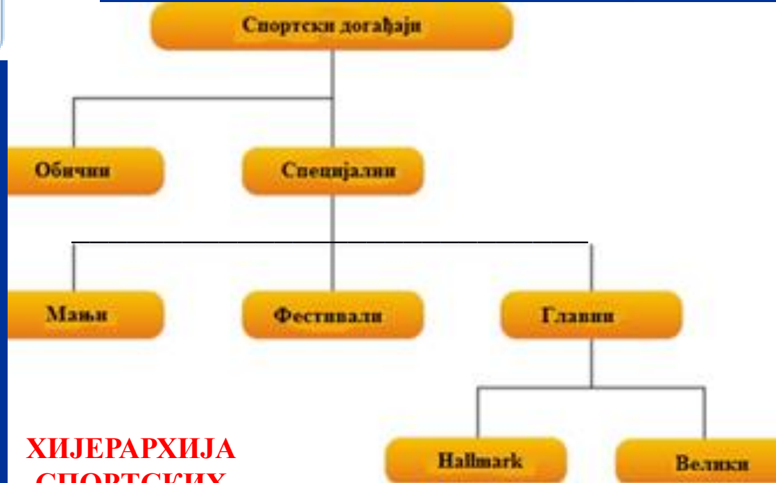
ХИЈЕРАРХИЈА СПОРТСКИХ ДОГАЂАЈА