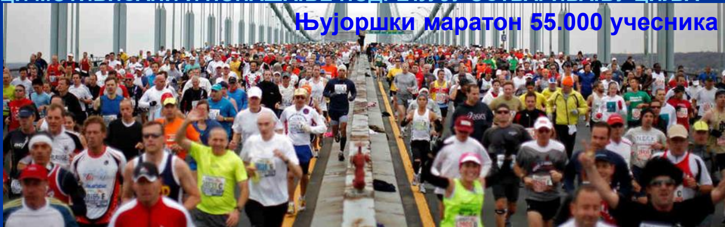
Њујоршки маратон 55.000 учесника