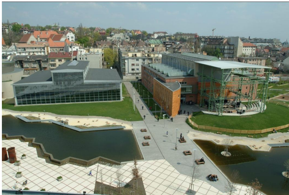
Slika 2: lokacija festivala

Na teritoriji današnjeg kulturnog centra Millenariš sredinom XIX veka, Ganz Abraham je osnovao fabriku čelika, koja je širom sveta poznata po patentu (transformator) istraživačke laboratorije. Prve dve zgrade datiraju iz 1897.godine, dok je najveći izložbeni prostor završen 1911.godine.