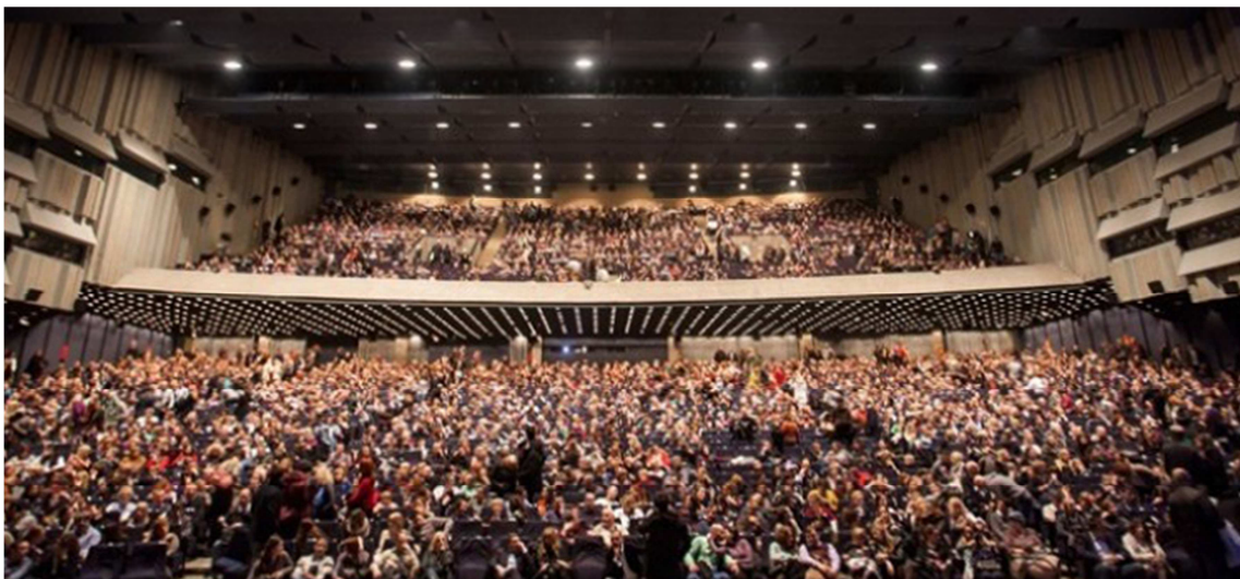
Слика 8. – Сала Сава Центра