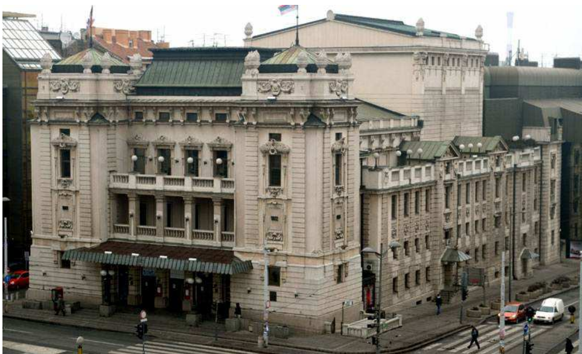
Слика 1. - Народно позориште

Београд је и седиште највиших државних и националних институција културе и уметности као што су Српска академија науке и уметности, Народна библиотека Србије, Народни музеј, Народно позориште и Универзитет уметности. Град Београд је и оснивач 36 установа културе, а истовремено помаже и реализацију пројеката 231 установе и уметничке асоцијације.