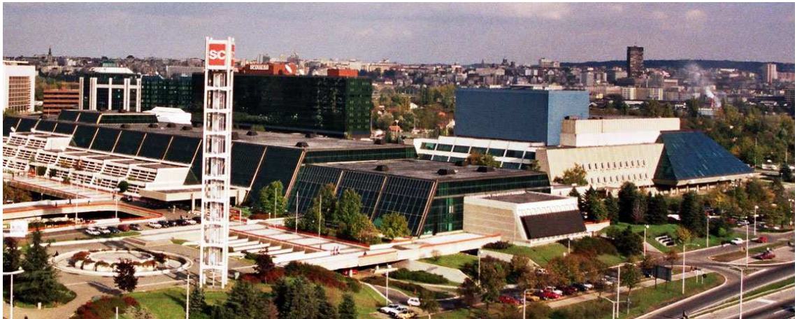
Слика 7. – Сава Центар

Ове године ФЕСТ са пројекцијама излази и ван биоскопских простора. Најновија екранизација Магбета је приказана у Народном позоришту док су два филма приказана и у ресторану Комунале и један документарни филм у Установи културе Стари град „Пароброд“.