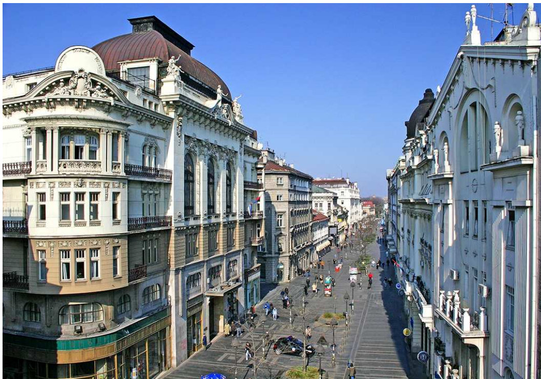
Слика 2. – Кнез Михајлова улица

Саве, Милошев конак, Стари двор, Земун и многе друге. Поред овога у граду се налазе многобројни паркови, споменици, музеји, кафићи, ресторани са обе стране реке Саве. Посебно популарни су Топчидер, Кошутњак и Ада Циганлија.