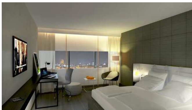
Слика 11. – Хотел Crowne Plaza