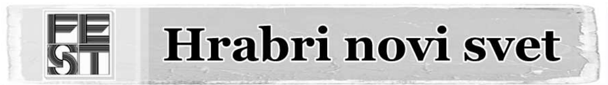
Слика 4. - Слоган првог ФЕСТ-а

Први београдски међународни филмски фестивал- ФЕСТ отворен је 9. јануара 1971. године у Дому Синдиката у Београду под насловом „Храбри нови свет“.