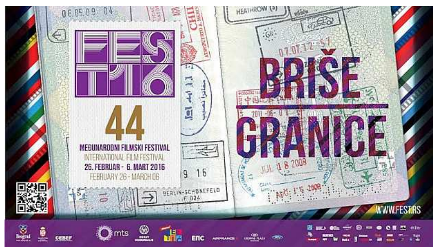
Слика 5. – Слоган 44. ФЕСТ-а

ФЕСТ се по правилу одржава у првој четвртини године. Последњих година увек крајем фебруара и почетком марта. Ове године одржан је 44. ФЕСТ по реду и трајао је од 26. фебруара до 6. марта 2016. године.