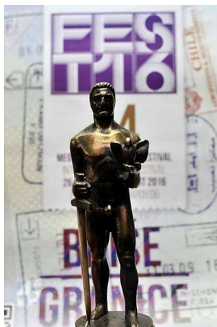
Слика 10. – Статуета Београдски победник

Награда „Београдски победник“ за животно дело и изузетан допринос филмској уметности се додељују накнадно, као и награда „Београдски победник“ за досадашње стваралаштво.