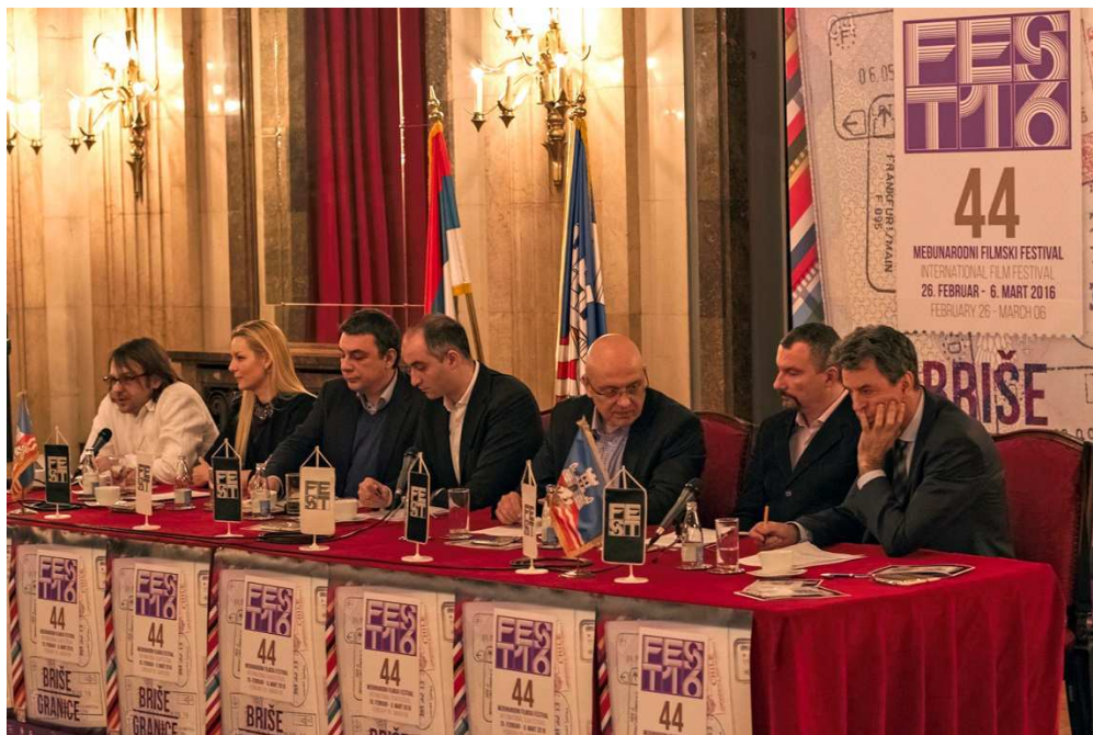
Слика 10. – Конференција поводом отварања 44. ФЕСТ-а

ФЕСТ је стекао и велики број пријатеља међу ресторанима у Београду. За све учеснике ФЕСТ-а током трајања самог фестивала нуде се специјални попусти од 10%, 15% и 20% на храну и пиће у око 30 познатих ресторана широм Београда.