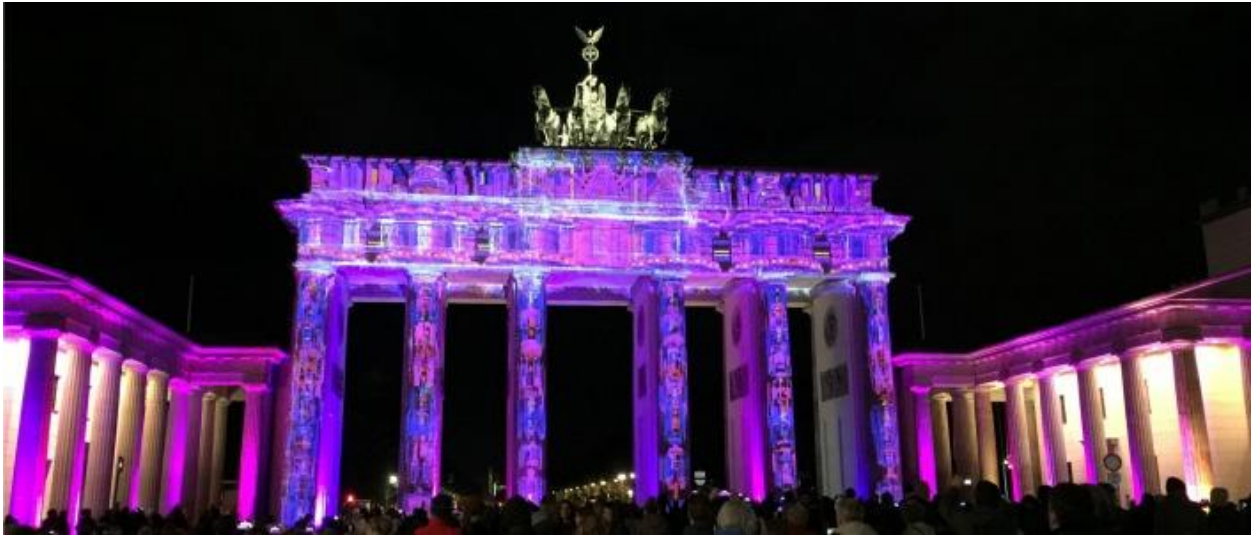
Слика 5. Брандербуршка капија током фестивала светлости 2017.године

Берлински фестивал светлости одржава се сваке јесени на улицама Берлина и обасјава око 500 грађевина, улица и тргова значајних за овај град. Крајњи резултат одраз је врхунске уметности и креативности најбољих светлосних дизајнера света. Фестивал је дакле специфичан по томе што се одвија у отвореном простору у који је свако добродошао.