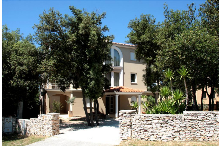
Слика бр.8: Вила Елизабета

Villa Seamare One - Овај објекат је удаљен 10 мин од плаже. Вила Сеамаре Оне има приватни базен и поглед на море. Налази се у Пули. Смештај има бесплатан интернет. Вила има 6 спаваћих соба, ТВ са равним екраном са сателитским каналима и потпуно опремљену кухињу која пружа гостима машину за прање судова, пећницу, машину за прање веша, микровална пећница и тостер