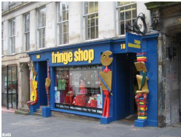
Слика 4. Радња Друштва Фринц

Друштво Единбург Фестивала Фринц је организација која подржава сам Фестивал Фринц. Ово Друштво настало је 1958. године као одговор на успех дотадашњих представа. Оно је формирало централну канцеларију и радњу (слика 4), и објављује програм Фестивала.