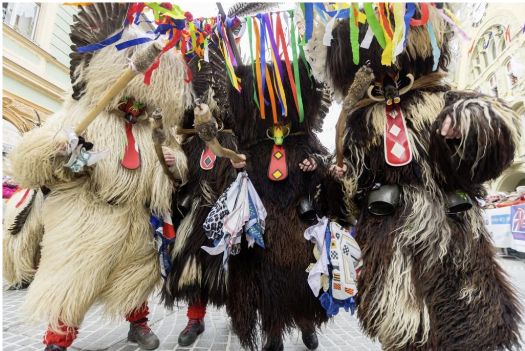
Слика 5. Куренти

Курент или Корант, је најпопуларнија традиционална карневалска фигура Словеније. Његово порекло још увек није у потпуности схваћено, иако неки извори говоре како је повезано са илирском и келтском традицијом као и митским следбеницима богиње Цибеле. Према древном веровању, Курент је демон који тера зиму и призива пролеће.