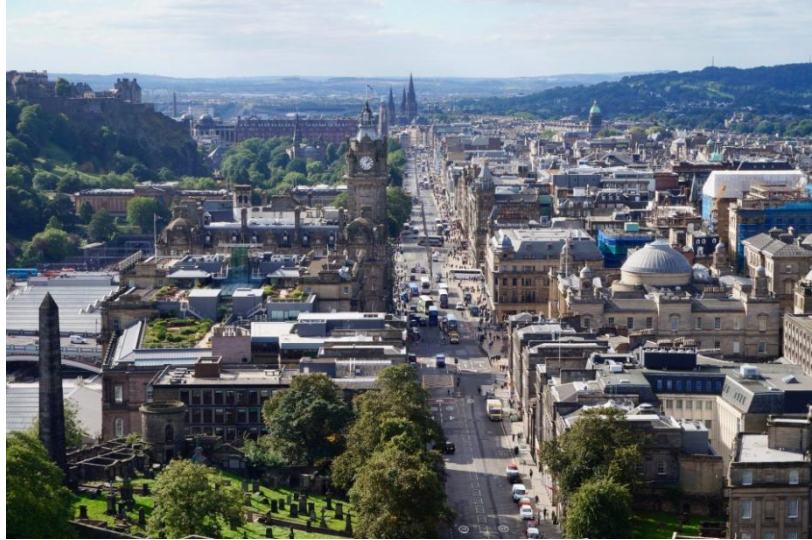
Слика 2. Улица принчева

завршавале великим трговима. Црква Светог Георгија на западу и црква Светог Андрије на истоку, маркирале су границе тог кварта. Главна улица је Улица Георгија, која прати природни пад Старог града, а уз њу се пружају Улица принчева (слика 2) и Улица краљице, испуњене неокласицистичким грађевинама. Роберт Адам је уредио трг Шарлот, који се сматра врхунцем овог стила, а на њему се налази прва резиденција шкотског премијера. Средином XIX века, у овој четврти је изграђена Шкотска национална галерија и Краљевска шкотска академија, изнад насипа некадашњег мочварног канала.