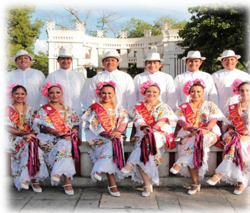
Foklorni balet Jukatana