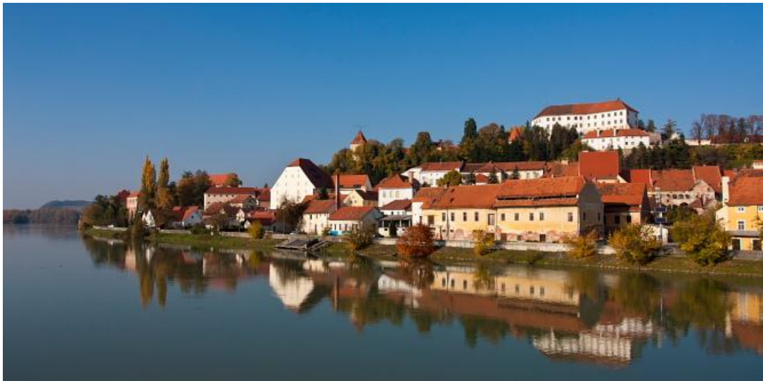
Слика 1. Птуј

Птуј се уврштава међу највећа некадашња средишта митраизма у Европи. Три светишта су била откривена на десном, а два на левом брегу реке Драве. Први датира из средине 2. века н. е., а био је откривен 1898—1899. године, те представља најстарије Митраистичко средиште подунавских провинција. Митра (митологија) је аријски (персијски) бог светлости његов мистични култ се из Персије преко Рима, раширио на ово подручје. Године 1901. био је откривен други митра, чији споменици су у крипти доминиканске цркве у Птују. На Горњем Брегу уз поток Студенчица стоји трећи митра, грађен средином 3. века н. е.