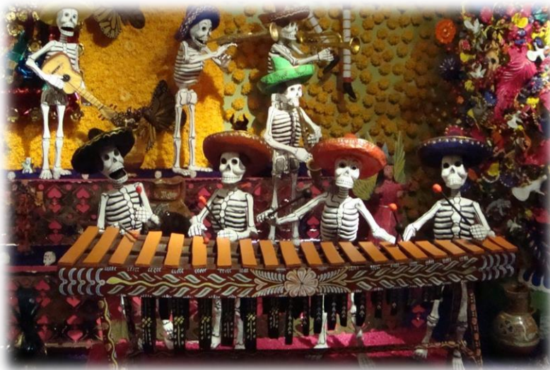
Slika 8. Muzički instrument marimba