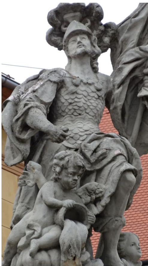
Слика 2. Споменик Светом Флоријану

Градски трг у Птују је након великог пожара (1744. године) добио име по Светом Флоријану чији се споменик налази на највишој тачки трга. Свети Флоријан је заштитник од пожара и представља празник ватрогасаца.