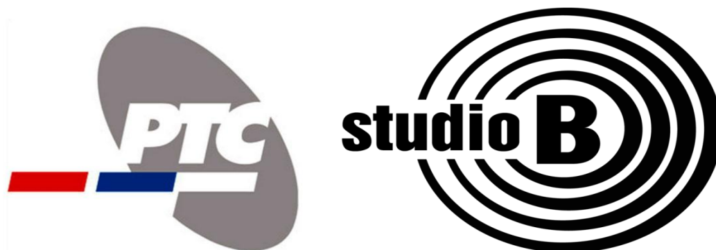
Слика 15. Медијске куће

Посебна пажња посвећује се Гала концерту у Сава центру који се одржава задње вече. Програм концерта се директно емитује на 2. програму РТС-а.