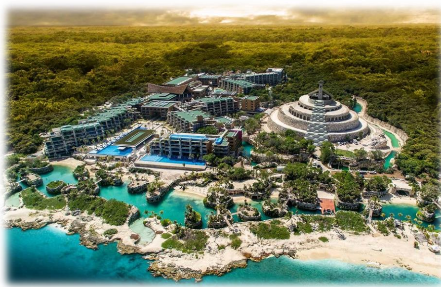
Slika 10. Hotel Xcaret Park

Sa oko 900 soba raspoređenih u različitim objektima pod nazivom "Casas", Hotel Xcaret Meksiko odaje poseban priznanje regionu Maja. Svaka 'Casa' predstavlja univerzalni element, osnovukulture Maja: spirala, vetar, voda, zemlja i vatra ( http://www.xcaret.com/hotel-xcaret-mexico.php ).