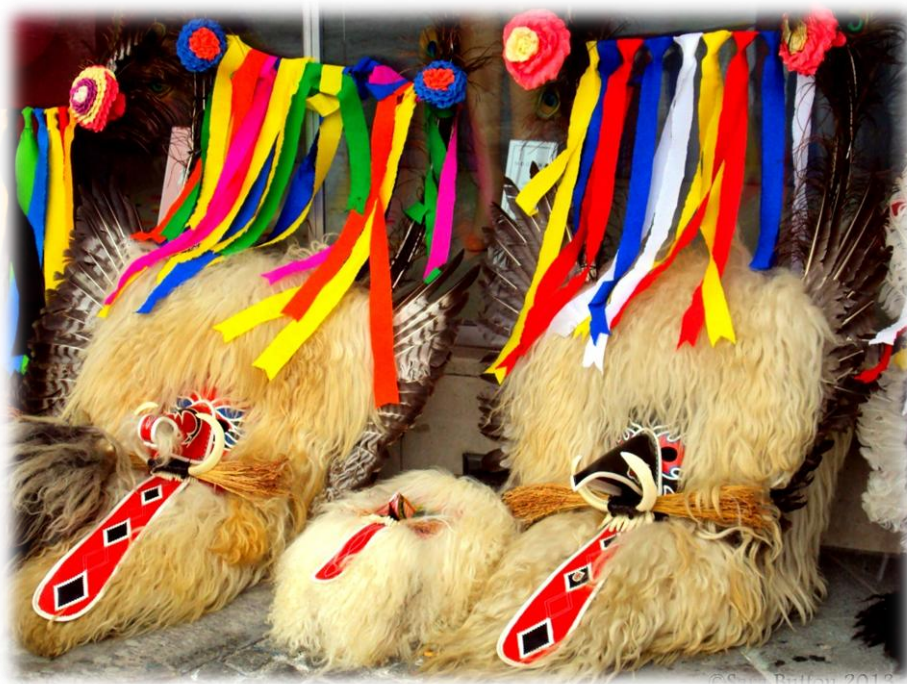
Слика 6. Маска Курента