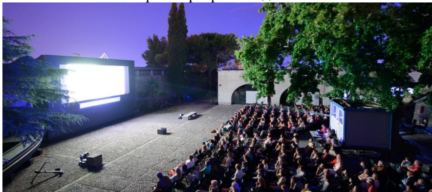
Слика бр.3 : Програмски део Каштела