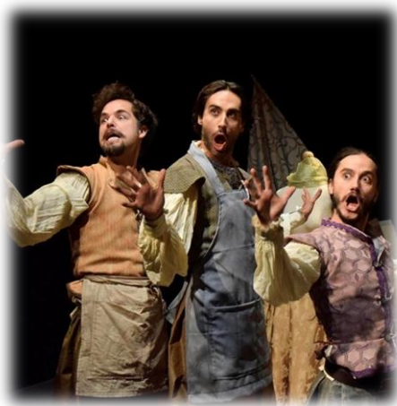
La Obra de Bottom*