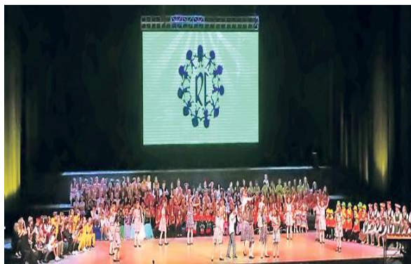
Слика 9. Задњи дан фестивала, Гала вече у Сава центру