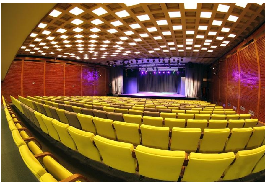
Слика 11. Велика сала Донка Шпичек (капацитет = 439 места, величина сцене 160 м2)

Дечји културни центар Београд нуди простор у коме се могу одржавати конгреси, конференције, семинари, презентације, представе, концерти и други догађаји. С обзиром да се налази у самом центру града, Дечји културни центар Београд веома је погодан простор до којег је лако доћи.