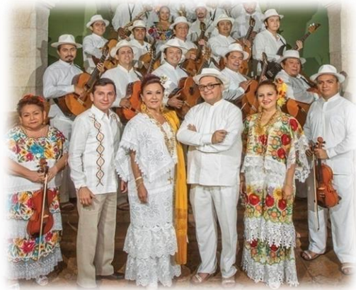
Tradicionalni orkestar Yukalpetén