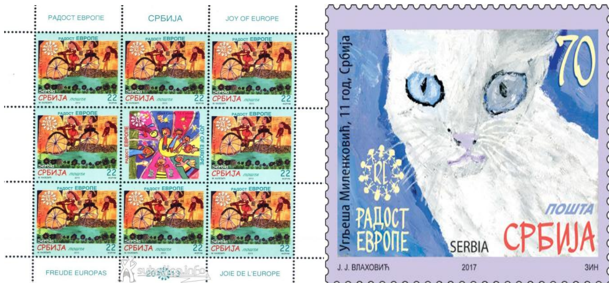
Слика 10. Поштанске маркице „Радост Европе“