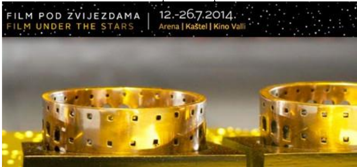
Слика бр.5: Златна Арена

Награда Никола Танхофер – за најзначајнија постигнућа на подручју филмске слике у категоријама за дугометражни играни филм, краткометражне форме и ТВ серију за протеклу годину; награду додељује Хрватска удруга филмских сниматеља.