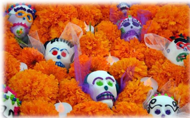
Slika 4. Cvet mrtvih