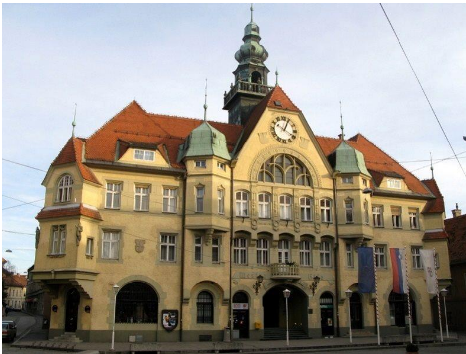
Слика 3. Градска кућа