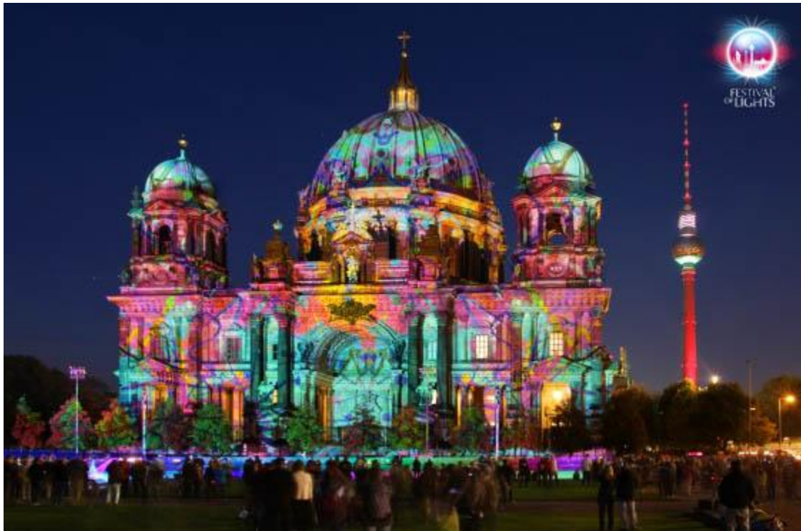
Слика 4. Призор са Берлинског фестивала светлости

Берлински фестивал светлости или „Berlin leuchtet“ је сада већ традиционална манифестација која се већ пуних 10 година организије сваке јесени на улицама Берлина. Током 17 дана, колико ова манифестација траје, Берлин је престоница светлости и његове улице, зграде и главни тргови осветљени су оригиналним светлосним дизајнима. Да би неки уметник добио одобрење и прилику да дизајнира осветљење на овом фестивалу мора се пријавити и најкасније у априлу текуће године и проћи у круг одабраних за овај одговоран задатак.