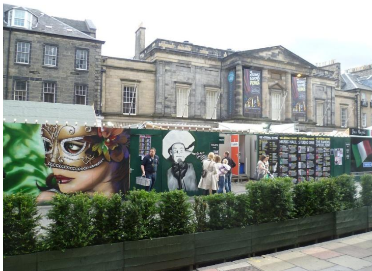
Слика 5. Скупштина за време Фестивала