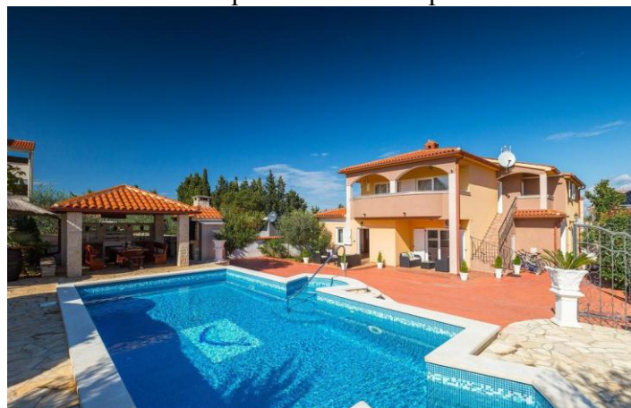
Слика бр.9: Вила Сиамаре Оне

Villa Seamare One - Овај објекат је удаљен 10 мин од плаже. Вила Сеамаре Оне има приватни базен и поглед на море. Налази се у Пули. Смештај има бесплатан интернет. Вила има 6 спаваћих соба, ТВ са равним екраном са сателитским каналима и потпуно опремљену кухињу која пружа гостима машину за прање судова, пећницу, машину за прање веша, микровална пећница и тостер