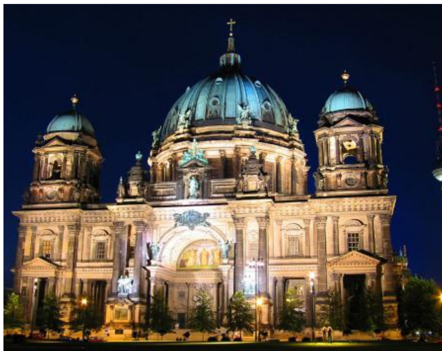
Слика 3. Берлинер дом – Берлинска катедрала

За љубитеље шопинга право место у Берлину је главна улица некадашњег западног Берлина - Курфурстендам страсе, познатија као "Ку-дам" булевар. Највећи део заузимају продавнице изузетно скупих и ексклузивних робних марки, док су у доњем делу улице тржни центри и робне марке приступачније цепу обичног Берлинца или госта. Ову улицу данас, како смо чули у Берлину, држи углавном капитал богатих Руса.