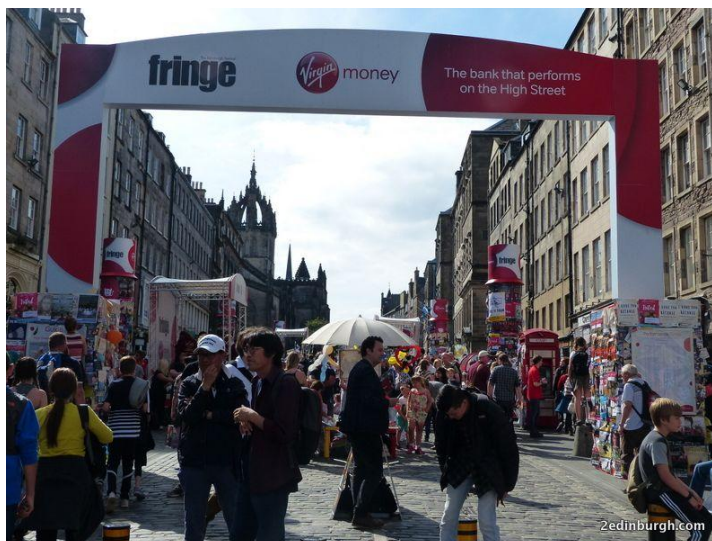
Слика 7. Virgin Money - главни спонзор Фестивала

Главни спонзори Единбург Фестивала Фринџ 2018. године су банка Virgin Money и пивара Каледонија. Virgin Money (слика 7) представља познати бренд у домену финансијских услуга. Услуге овог бренда тренутно су доступне у Аустралији, Северној Африци и Уједињеном Краљевству. Каледонијска пивара је шкотска пивара основана 1869. године у области Шандон у Единбургу.