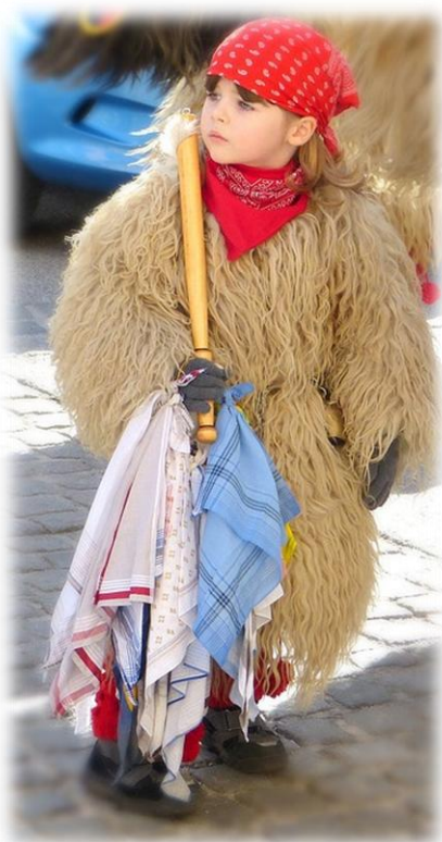
Слика 7. Девојчица Курент

У првим деценијама 20. века мушкарци су сами себи правили целокупну маску, углавном од материјала који им је био приступачан: старо крзно, зечја или козја кожа итд. Према подацима из Марковаца, крајем 19. века Курент је био окарактерисан као биће које је побегло из пакла и сјединило се са Луцифером. Био је обучен у извртну кожу, покривен „капом“ такође од изврнуте коже. Имао је криве роге на чијим крајевима се налазило гушчје перје.