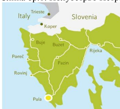
Слика бр.1: Полуострво Истра