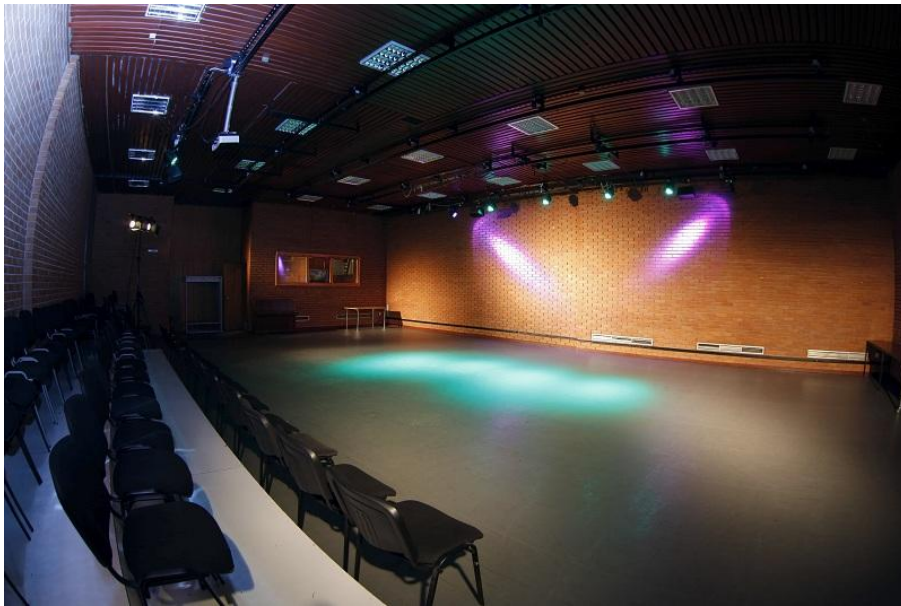
Слика 12. Мала сала (капацитет = 150 места)