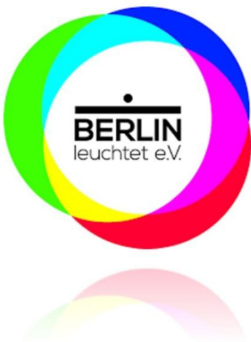
Слика 7. Лого фестивала светости и Берлину

Ове године фестивал ће почети 28. Септембра. Сви садржаји везани за програм дешавају се у вечерњим часовима. Током трајања овог фестивала читав Берлин је будан ноћу. Пошто се фестивал не организује у затвореном простору и сви садржаји су бесплатни за оне који обилазе грађевине и шетају градом у сопственој режији. Ипак, да би се магија овог фестивала потпуно осетила потребно је резервисати своје место у неком од туристичких аутобосу за разгледање града или обилазити град пешачком туром у пратњи туристичког водича који ће живописно дочарати тематику самог фестивала, објаснити идејна решења уметника који су дизајнирали осветљење зграде и поруке које ти уметници шаљу.