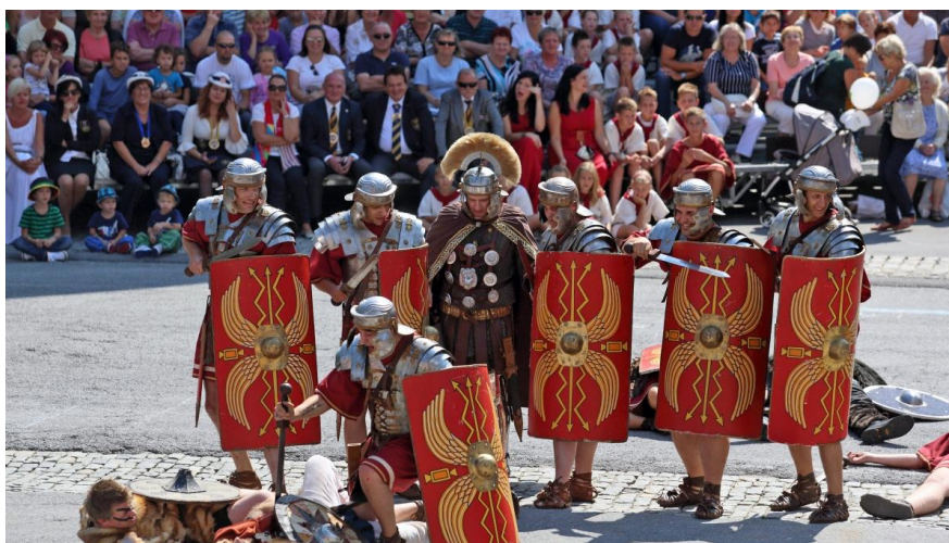
Слика 4. Римске игре

Најпознатија манифестација локализована управо овде одржава се током августа под називом Римске Игре. Бања се кроз Игре претвара у стару римску Петовиону. Поред Римских Игара, оно по чему је Птуј познат јесте и велики Птујски карневал – Курентовање.