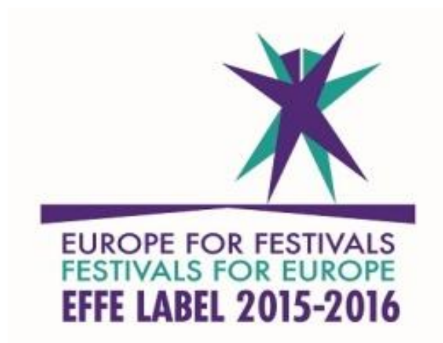
Слика 7. – ЕФФЕ – Сертификат квалитета

Међународни сусрет деце Европе – Радост Европе добитник је етикете квалитета ЕФФЕ (Европа за фестивале – фестивали за Европу) 2017-2018. Ова награда је додељена од стране пилот пројекта Европске комисије. Ово је још једна потврда да је Радост Европе препознатана европској мапи фестивала као дечји фестивал са дугом традицијом и фокусом на развијању креативности, знања и пријатељстава међу децом, са значајним утицајем на локалну заједницу и високим уметничким квалитетом. О пристиглим апликацијама одлучивао је национални и интернационални жири.