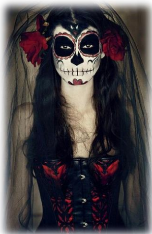
Slika 6. La Catrina

Calaca je skelet, calavera je lobanja, a calavera de azucar je šećerna lobanja (koja je zamrznuta, u obliku lobanje napravljena od šećerne paste i ukrašena šarenim šarama). Najpopularnija calavera od svih je "La Calavera Catrina", dama iz visokog društva sa skeletom u fensi cvetnom šeširu, iz sredine 1910. godine meksičkog umetnika Josea Guadalupa Posada. Ona je postala najpoznatiji simbol Dana mrtvih.