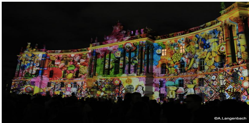
Слика 6. Зграда скупштине током фестивала светлости 2016. године

Коначан избор локација које ће бити осветљене и улепшане специјалним светлосним ефектима зависи од идејних решења дизајнера који су се пријавили на конкурс. Наравно главни градски тргови и грађевине попут Берлинске катедрале, Александар трга, Брандербуршке капије и сличних добро познатих локација су увек обухваћене овим фестивалом.