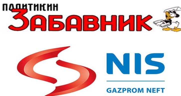
Слика 16. Спонзори фестивала

Пријатељи фестивала су Туристичка Организација Београда, Туристичка Организација Србије, Бео Зоо Врт, Паркинг сервис, Сава центар, Ада Циганлија, Београд пут, Фруит Компани, Аква Гала и Алма Куаттро; МЕДИЈСКИ СПОНЗОРИ: РТС, Студио Б, Политикин Забавник и Илустрована политика.