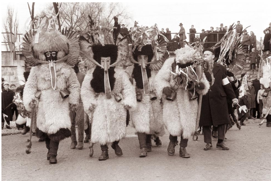
Слика 8. Први Карневал у Птују

За становнике града и околине, маскирање је део личног идентитета, свакодневне личне мантре, везе са мистиком и бекство из земаљског света. Спајање ових елемената у комплетну карневалску причу пружа посетиоцима јединствено и незаборавно искуство карневалског времена. Током фестивала, бројни догађаји се дешавају у граду и околини; етнографке и карневалске параде, карневал и презентација етнографских ликова, концерата и плесова у маскама и другим бројим догађајима. Становници Птуја и околине живе са њима и за њих, што подразумева да када је време карневала, сви узимају годишње одморе, повећују се карневалу у потпуности. Први Карневал одржан је 12. фебруара 1961. године.