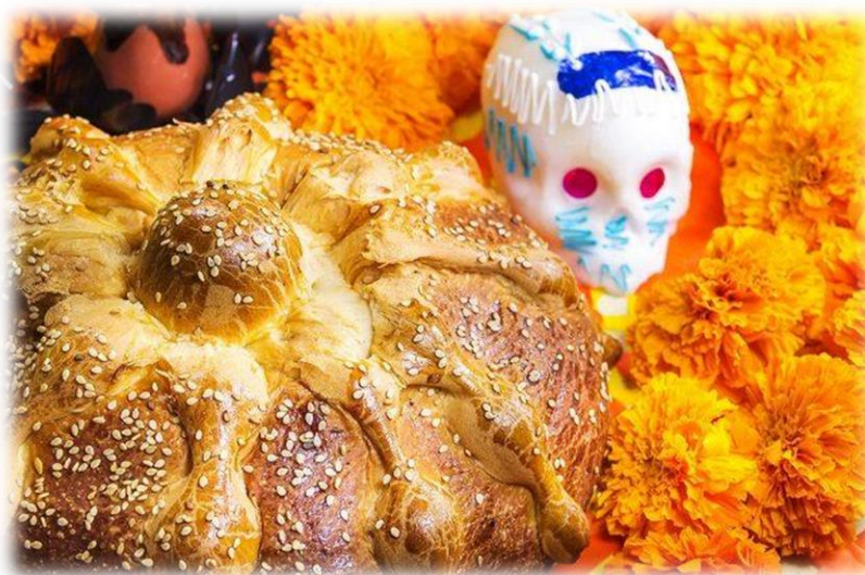
Slika 5. Hleb mrtvih i šećerna lobanja