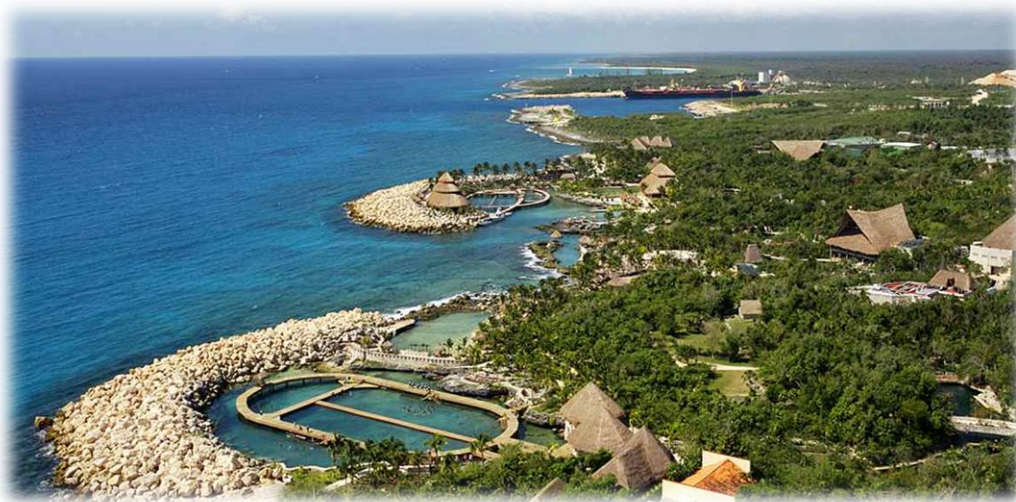
Slika 1. Xcaret park

Prirodne atrakcije parkova uključuju reku koja prolazi kroz selo Maja, podzemnu betonsku šupljinu u kojoj ljudi mogu da plivaju. U blizini ulaza nalaze se rekreativne aktivnosti na plaži, ronjenje, Sea Trek i Snuba u obližnjim grebenima, ili plivanje sa delfinima. U parku se nalazi gnezdo akvarijumske kornjače koralnog grebena. Pored ulaska postoji oblast za manatees. U parku se nalazi i paviljon ptica, paviljon leptira, pećina leptir, orhideje i bromeliad staklenik, ostrvo jaguara, i jelenovo sklonište, između ostalog.