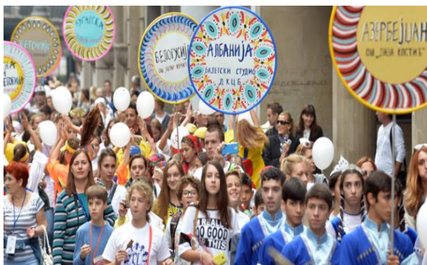
Слика 8. Први дан фестивала, Карневал кроз Кнез Михаилову

Идеја је да деца и њихови педагози инспирисани природним лепотама, енергијом сунца, таласа, воде, ветра, рециклажом или слободним тумачењем слогана манифестације припреме своје нумере за Гала концерт, уколико природа наступа то дозвољава. Тема може бити интерпретирана широко, у складу са уметничким сензибилитетом групе.