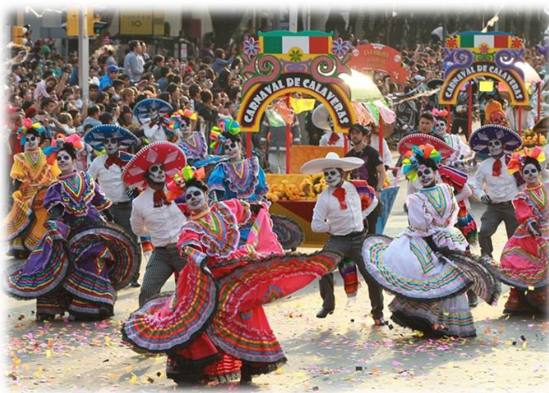
Slika 7. Ples tokom Dana mrtvih