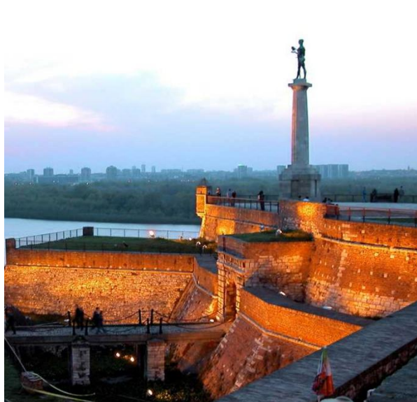
Слика 2. – Калемегдан

Из године у годину број туриста који посети Србију и њен главни град је све већи. Од 2000. године приметан је повратак страних туриста одсутних још од ратова 1990-их година. Највећи број туриста је из земље и региона, посебно младих из Хрватске, Словеније и Босне и Херцеговине.