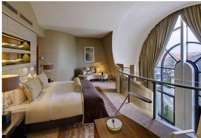
Слика 7. Унутрашње уређење собе хотела „Хилтон“ у Берлину

Велики број младих одлучује се да одседне у пансионима , хостелима или чак у приватном смештају. Берлин има велику понуду и када је у питању приватан смештај. Наиме на сајту Air BnB може се пронаћи веома повољан смештај. Такође , у великим градовима , попут Берлина велике су могућности проналажења смештаја преко Couchsurfing –а.