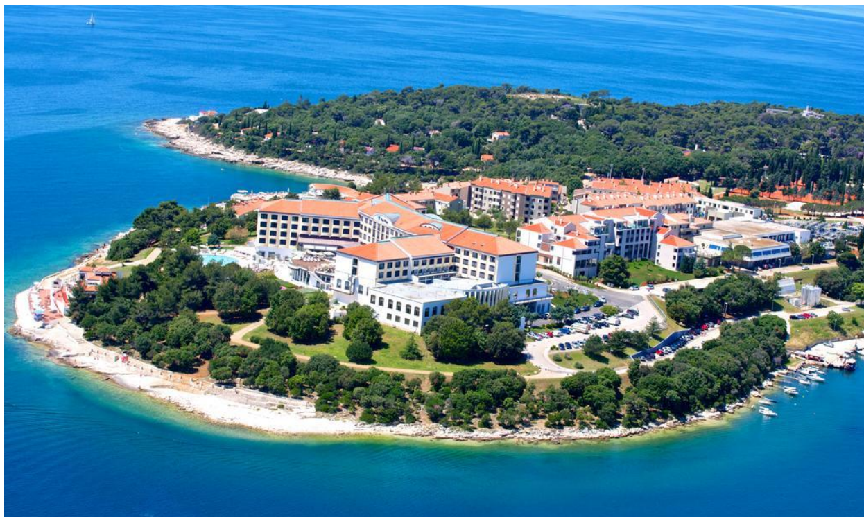
Слика бр.7: Хотел Парк Плаза

Велнес и спа центар површине 550 м 2 садржи затворени базен са морском водом, турско купатило, финску сауну, ледено купатило и зону за опуштање са загрејаним лежаљкама. Поред тога на располагању су вам потпуно опремљена теретана, фризерски салон и козметички салон са 4 просторије за третмане.