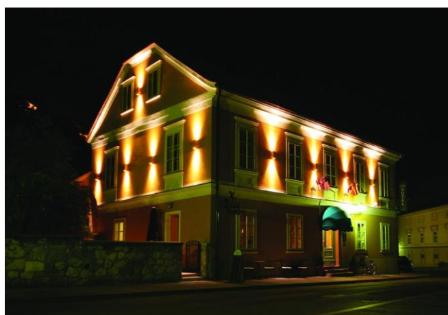
Слика 11. Хотел Парк

Хотел Парк се налази у некадашњој главној улици Старог града. У близини се налазе Птујски град, стари доминикански самостан и Мали град. Терме Птуј се налазе на само 9 минута хода од хотела