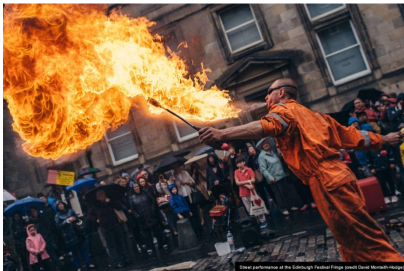
Слика 6. Уличне перформансе