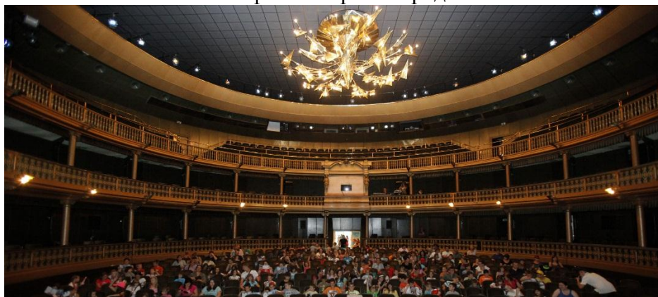
Слика бр.4: Истарско народно казалиште