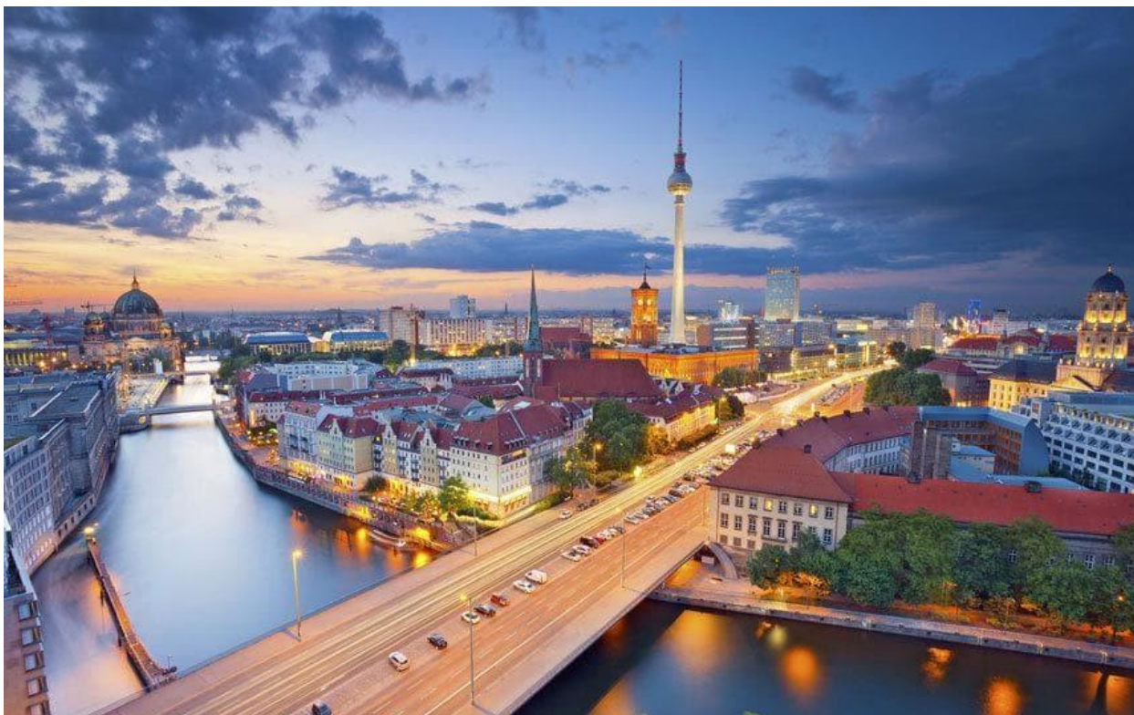
Слика 1. Панорама града Берлина

Берлин је град који се не може описати једноставним навођењем атракција. Он је нешто много више. Омиљен међу уметницима, скејтерима, тинејџерима, али и бизнисменима, има другачију причу од осталих светских метропола. То су два града спојена у једном... Простире се на невероватних 900 квадратних километара и подељен је на 12 области. На Старом континенту по величини је одмах иза Лондона. Захваљујући ратној подели, град има два центра и чак 18 Универзитета. Оно што највише интригира све посетиоце Берлина је прича о Зиду. Подигнут је, као жичана ограда 1961. и након тога је, све до 1989. "унапређиван" и ојачаван. Током његовог постојања било је 5.000 успешних пребега у Западни Берлин. Најпознатији неуспешни пребег је из 1962. када је Петер Фехтер погођен и остављен да крвари до смрти. Последња жртва зида је Крис Гвефрој из фебруара 1989. Некадашњи симбол "хладног рата" чувени Берлински зид, који је поделио државу и град на капитализам и комунизам, подугнут је за једну једину ноћ! Укупну дужину од 160 километара, по неким и 200, чувале су 302 осматрачнице. Данас је од Зида остао само један мали део, који је претворен у галерију графита - "Еаст Сиде Галлери", коју су осликали уметници из целог света.