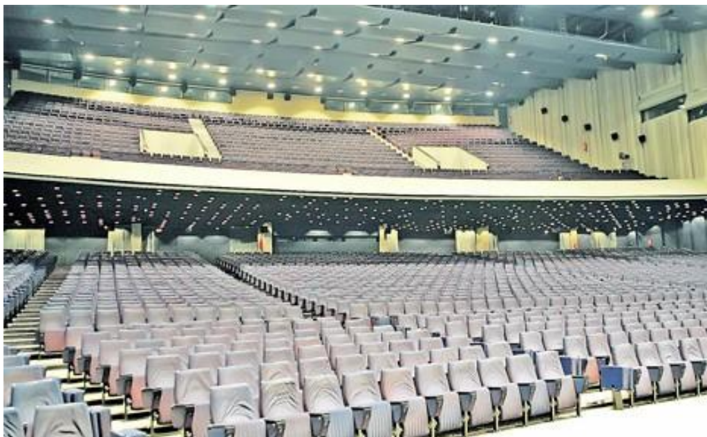
Слика 14. Сала Сава центра