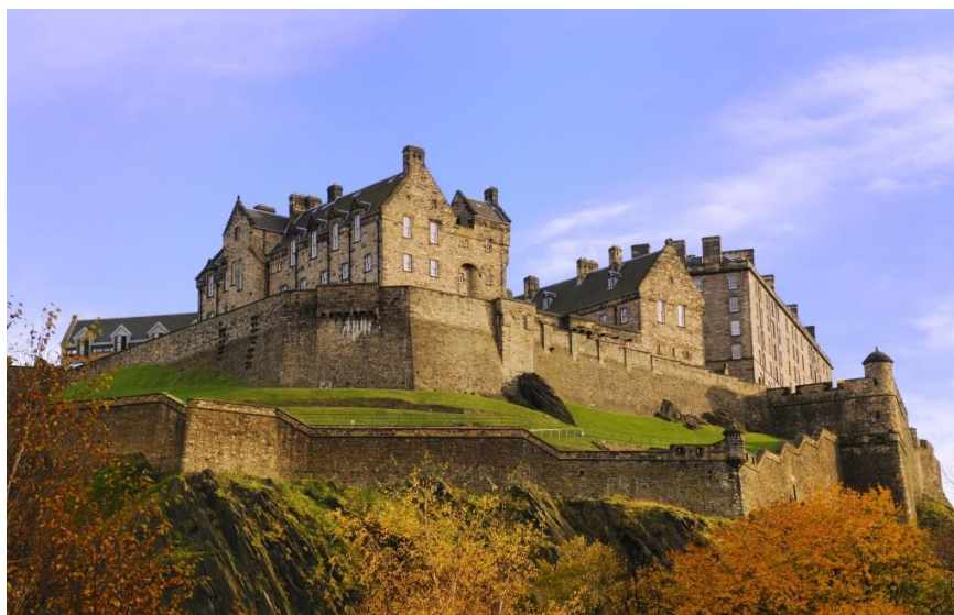
Слика 1. Единбуршки замак

Најимпресивнији споменик Старог града је Единбуршки замак (слика 1), подигнут на стени угашеног вулкана, која са својих 135 m доминира градом. Археолошка истраживања су показала да је стена била насељена још од трећег миленијума пре нове ере. Први документарни записи о њему као краљевском замку потичу из времена владавине краља Малцолма III (1058-1093), али је након тога често рушен и обнављан. Мала капела Свете Маргарете, најстарији објект у замку, посвећена је жени краља Малцолма III и налази се на највишој тачки стене. Она вероватно датира из доба владавине њеног најмлађег сина Давида I (1124-1153).