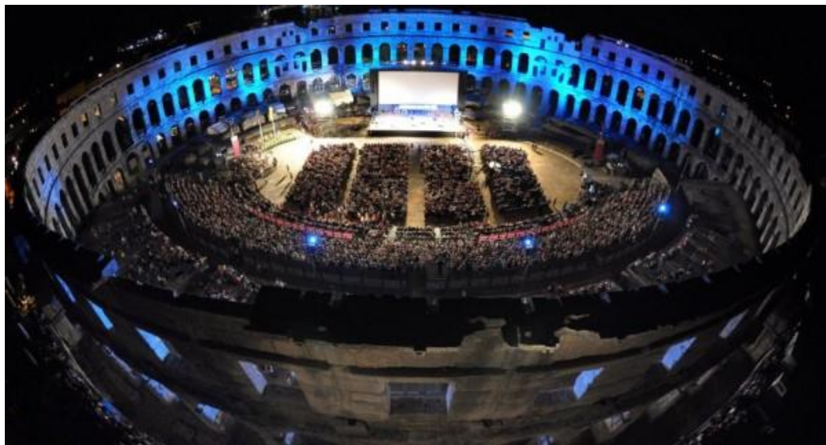
Слика бр.6: Пулска арена