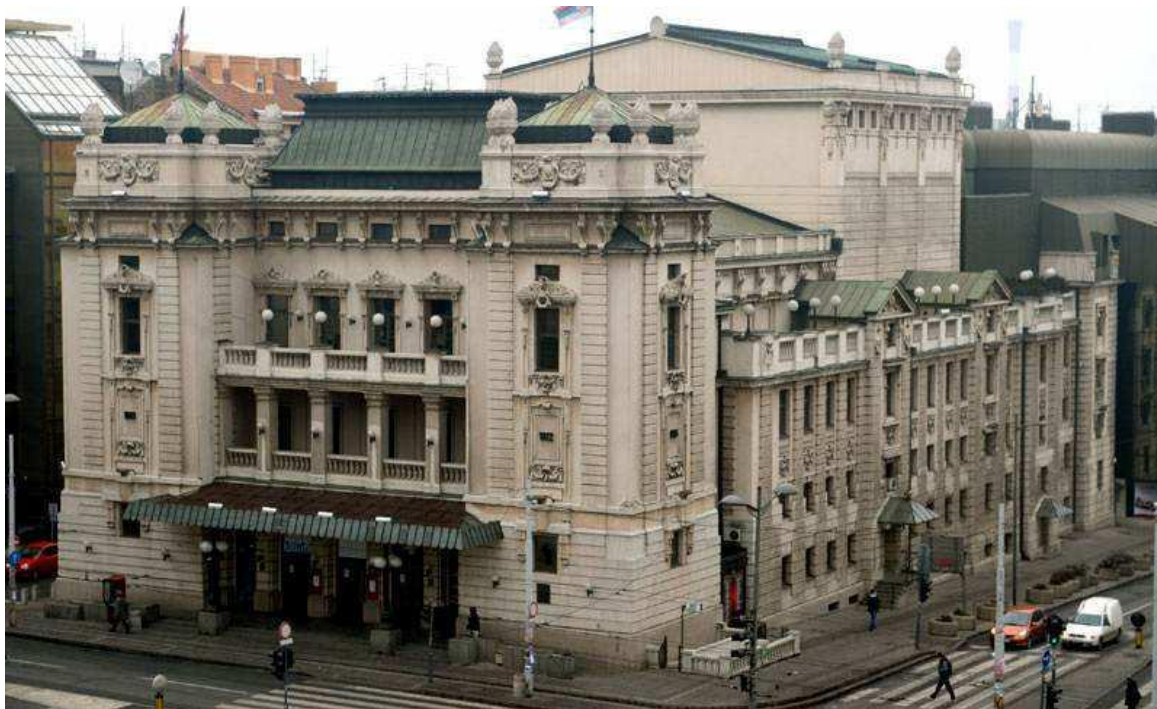
Слика 1. - Народно позориште

Београд има статус посебне територијалне јединице у Србији, која има своју аутономну градску управу. Његова територија је подељена на 17 општина, које имају своје локалне органе власти.