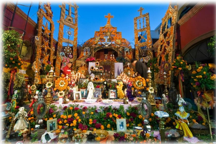
Slika 3. Oltar

Oltari predstavljaju najistaknutije karakteristike na proslavi jer pokazuju dušama put do kuće.