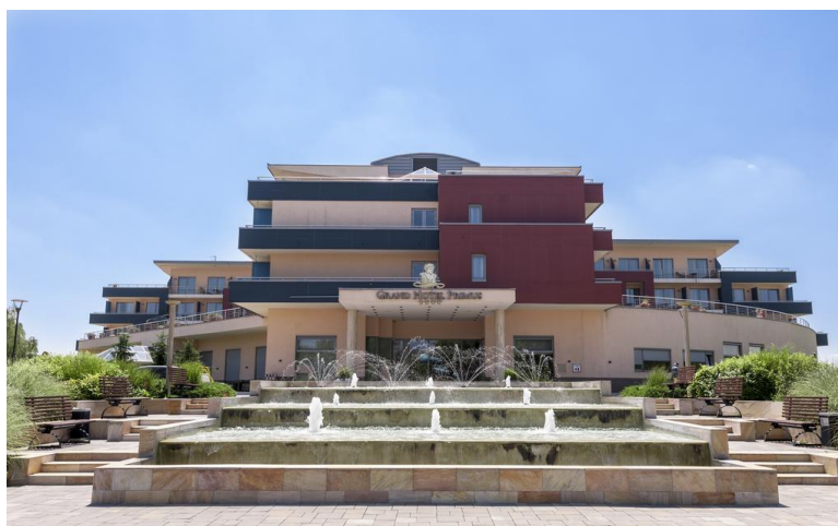
Слика 10. Grand Hotel Primus - Sava Hotels & Resorts

Један од хотела који нуди смештај посетиоцима је хотел Поетовио који се налази у самом центру града. Поред смештаја поседује и казино који ради преко целе ноћи па се бројни посетиоци одлучују управо за њега. Постоје два хотела са четири звездице. Grand Hotel Primus - Terme Ptuj - Sava Hotels & Resorts налази се на 1,2 km и нуди велики спа центар са базенима ресторане у склопу објекта у којима се служе врхунска јела и фитнес центар.