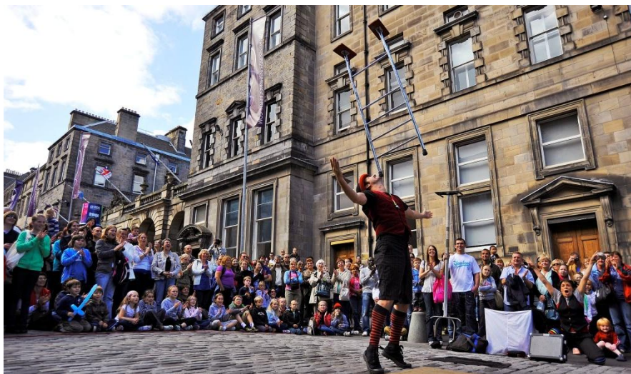
Слика 3. Единбург Фестивал Фринц

Единбург је фестивалски град. Он у току једне године буде домаћин бројним фестивалима, међу којима су: Фестивал науке, Фестивал филма, Џез и блуз Фестивал, Арт Фестивал, Интернационални Фестивал, Фестивал књиге, Фестивал приповедања, Единбург Фестивал Фринц (слика 3) и тако даље.