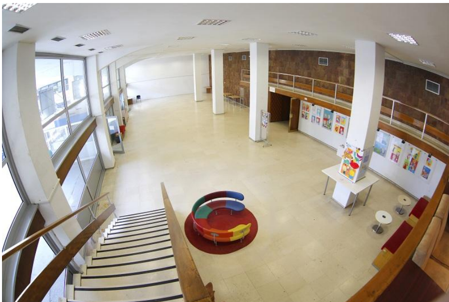
Слика 13. Атријум

Простор је опремљен свом потребном техником (озвучењем, микрофонима – статичним и бежичним, пројекционим платном и пројектором). Уколико је потребна додатна техника, као и кетеринг, Дечји културни центар је у могућности да и то обезбеди у сарадњи са дугогодишњим партнерима куће.