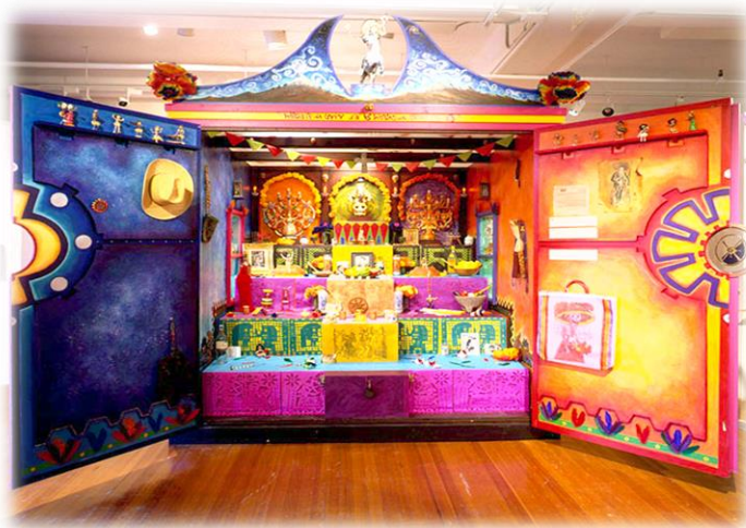
Slika 9. Izložba oltara