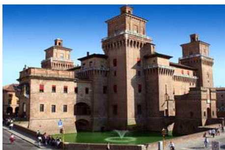
Slika 3. Kastelo Estens