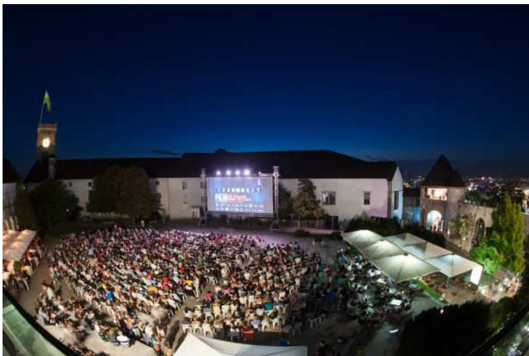
Slika 7: Film pod zvezdama - Ljubljanski zamak