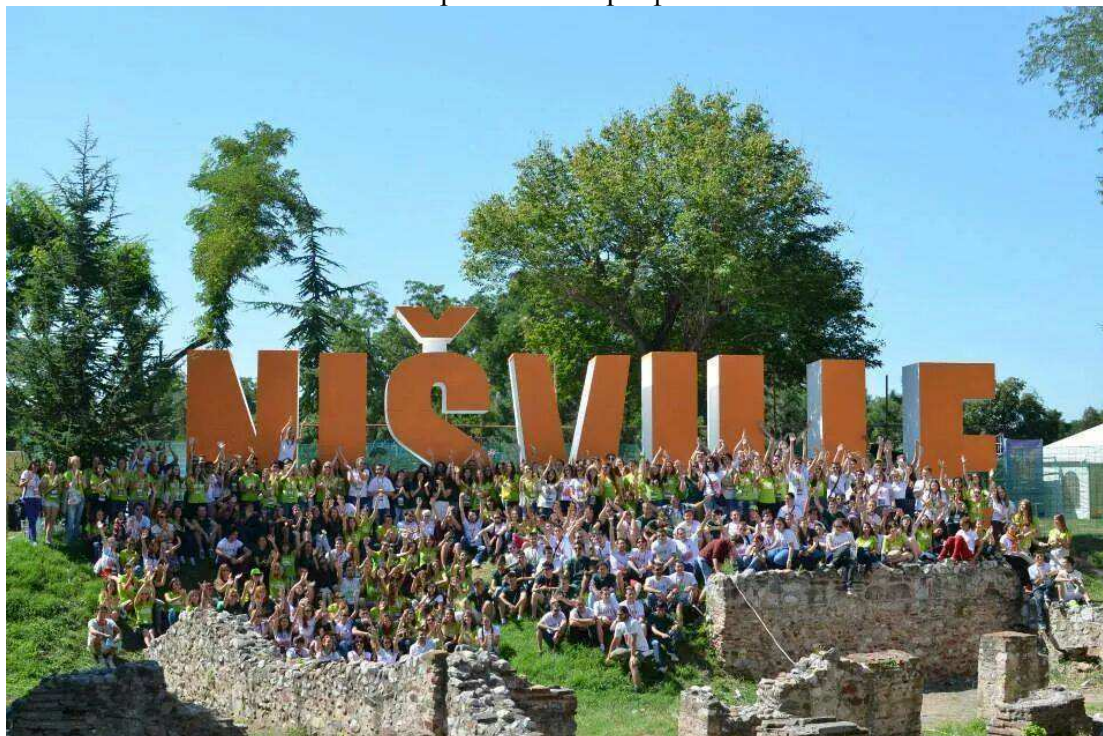
Слика бр. 7 Волонтери фестивала