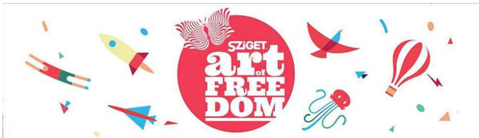
Slika 9. Logo projekta "The art of freedom"