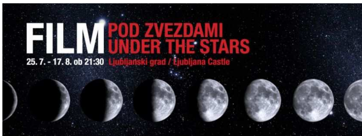
Slika 10: Promocijski plakat

Promocija za festival vrši se na nekoliko različitih načina – za ciljne grupe već nekoliko meseca pre samog događaja, ali za opštu publiku intenzivnije počne da promoviše oko tri nedelje pre samog festivala. U tom vremenu i objaviu program za sve tri nedelje. Domaći publici i turistima se festival promoviše sa slovenačkim i engleskim bilbordama po gradu, štampom i radiom (Mladina, Napovednik, Vikend, Time Magazine, Radio Center), na slovenačkih TV programima, u svih edicijama časopisa Turizem Ljubljana i ljubljanskog časopisa Kam, svake godine stave i tezge po celoj Ljubljani, koje sadrže letake sa informacijama o filmovima i sa programom. Na nekim mestima reklame sadrže samo naziv festivala i vreme te mesto održavanja, ali na letacima i u štampi predstavljen jeste čitav program sa opisima filmova. Internet stranica za ovaj festival postoji, ali nije baš informativna osim za posetilace – sadrži program filmova i cenu za posetu te uspinjaču.