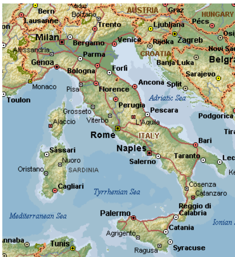
Slika 1. Mapa Italije