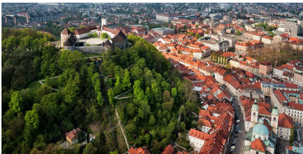
Slika 9: Centar Ljubljane sa zamkom

Prilikom nevremena odnosno otkazane projekcije, posetilaci može da si ogledaju film