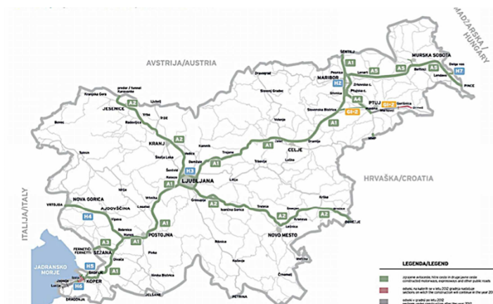
Slika 5: Autoputevi i regionalne ceste

U Ljubljani je dobro organizovan i gradski i prigradski saobraćaj (LPP) koji vozi često i redovno u sva naselja Ljubljane i okoline.