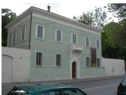
Slika 5. Ogranak muzeja Ermitaž