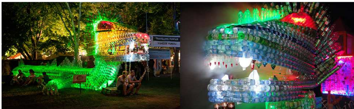
Slika 10. Zmaj konstruisan od PET boca