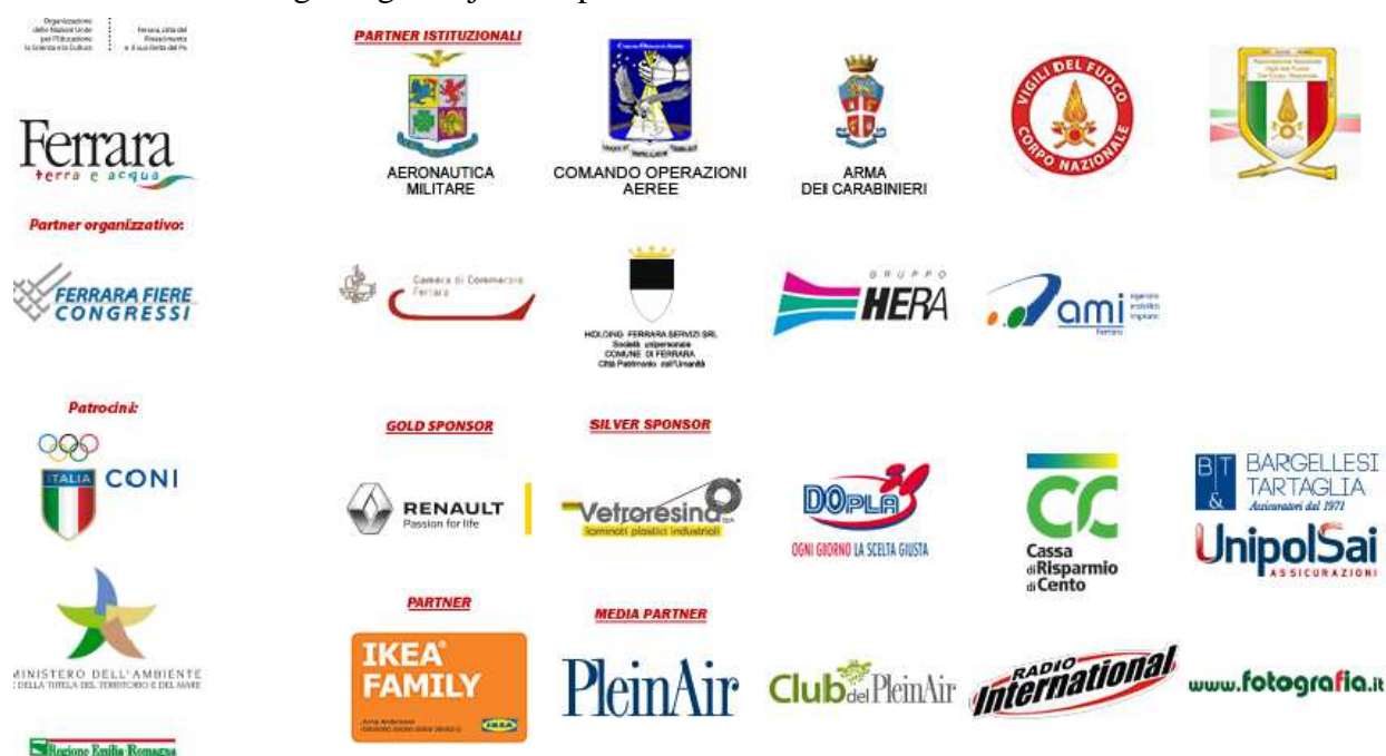
Slika 14. Sponzori Festivala