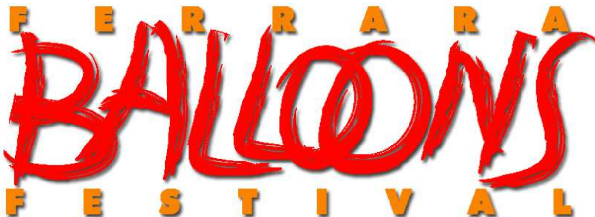
Slika 13. Plakat Festivala

Festival takođe štampa plakate, koji se postavljaju kako u samom gradu, tako i u široj okolini.