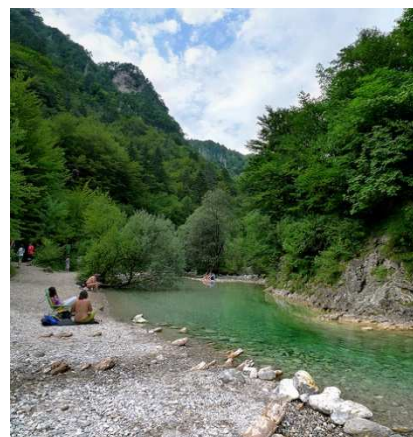
Slika 3: Iški vintgar

Ljubljana je vrlo živahan i mlad grad (stanovnici imaju u proseku nešto više od 30 godina) sa oko 50.000 studenata iz Univerziteta u Ljubljani (osnovan 1919. godine). Za njihovu zabavu brine se različita kulturna, sportska i druga dešavanja, kako i brojne druge institucije (muzeji, galerije, pozorišta, botanička bašta, parkovi, restorani, kafane, barovi i sl.). Kako život u gradu, raznovrsna je i prirodna i kulturna baština – arhitektura predstavlja isprepletanje starog sa novim – od nasleđa rimske Emone do renesanskih, baročnih i secesijskih odlika te romantičkih mostova i značajnih dela slovenačkog arhitekta Jožeta Plečnika u 20. veku. Za rekreaciju stanovnici može se popeti na blisku Šmarnu goru, šetati po Iškem vintgaru, ići biciklom po prirodnom parku Ljubljansko barje ili jednostavno sedeti u jednom od brojnih parkova ili pored Ljubljanice.