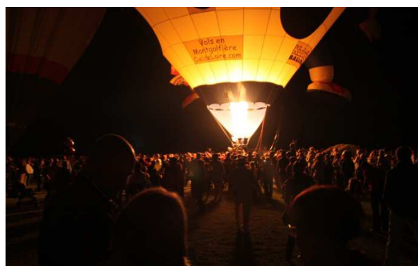
Slika 11.i 12. Predstava „Noćni sjaj“