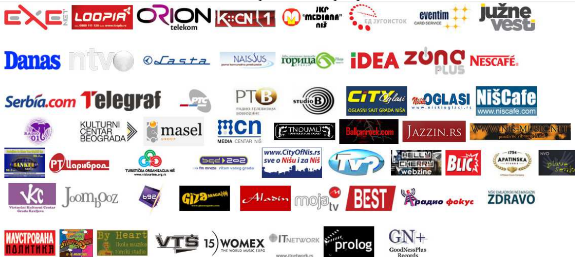
Слика бр. 8 Спонзори фестивала