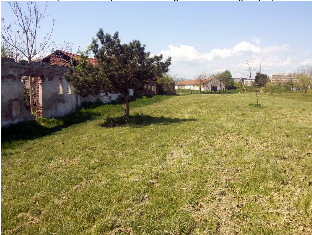
Слика бр. 4 Место одржавања "Midnight Jazzdance stage" програма