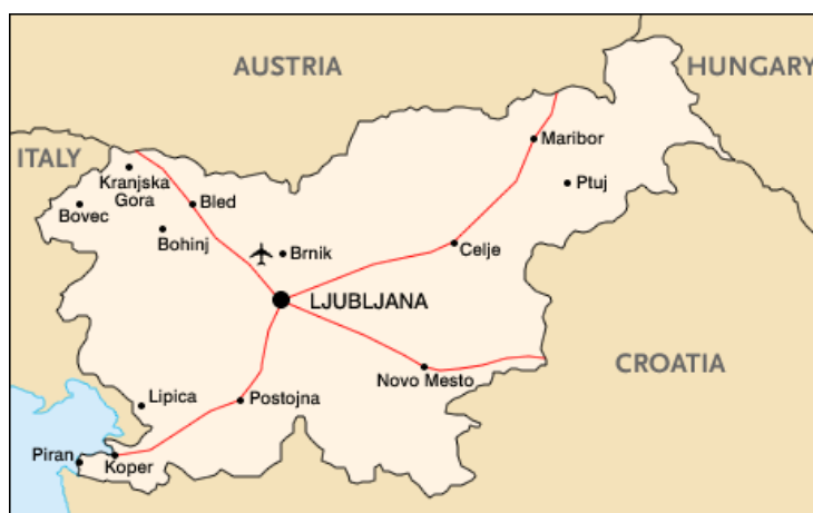
Slika 1: Autoputni krst i položaj Ljubljane

Glavni grad Republike Slovenije – Ljubljana je politički, naučni i kulturni centar slovenačkog naroda i sa oko 280.000 stanovnika predstavlja najveći grad u Sloveniji i njen privredni centar. Zbog svoje centralne lokacije je jedinstveno mesto jer je moguće u jednom danu iskusiti alpsko skijanje i kupanje u moru. Nalazi se u Ljubljanskoj kotlini, između Alpa i Jadranskog mora na reci Ljubljanici. Njena prednost je u lakoj pristupnosti i transportnoj dostupnosti jer se nalazi u centru slovenačkog autoputnog krsta koji ima jake veze i sa susednim zemaljama.