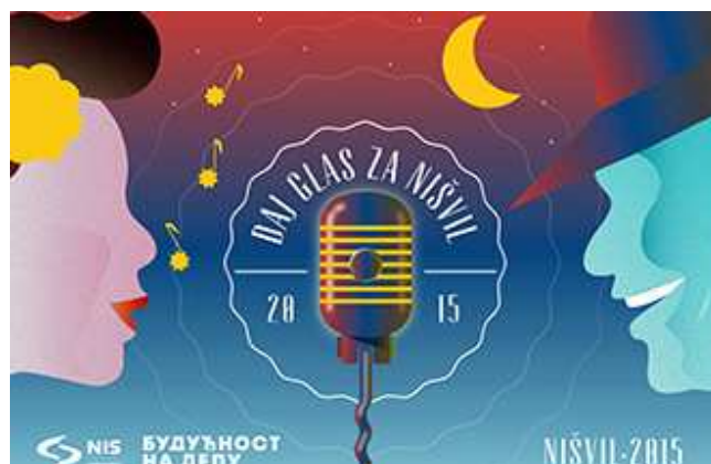
Слика бр. 6 Флајер за конкурс