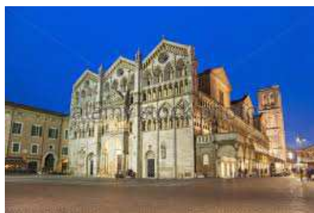
Slika 4. Katedrala Svetog Đorđa