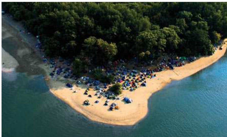
Slika 2. Ostrvo na kome se održava festival