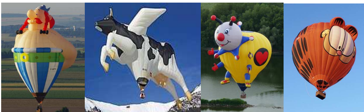
Slika 10. Specijalni oblici balona