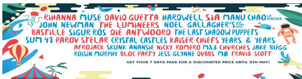
Slika 5. Najava programa za ovogodišnji festival