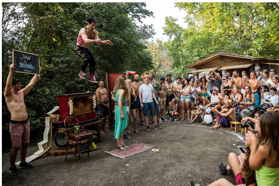
Slika 6. Deo atmosfere sa predstave koju izvodi mađarska cirkuska trupa