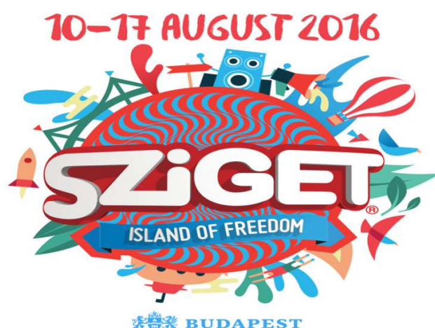
Slika 3. Logo festivala