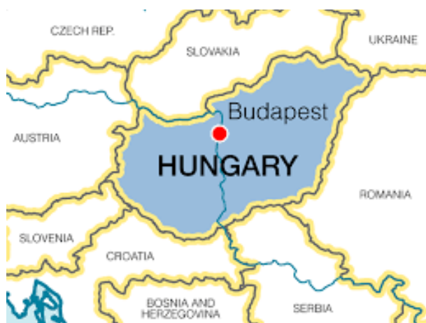
Slika 1. Položaj Budimpešte u Mađarskoj