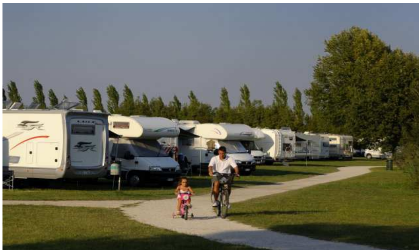
Slika 6. Kamp u Urban parku