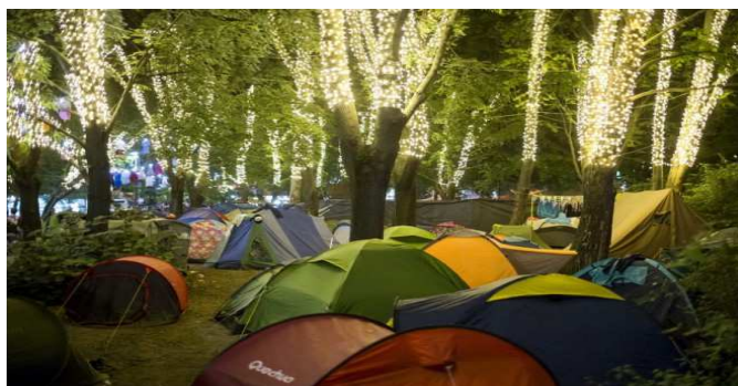
Slika 8. Kamp na “Ostrvu slobode” za vreme Sziget festivala