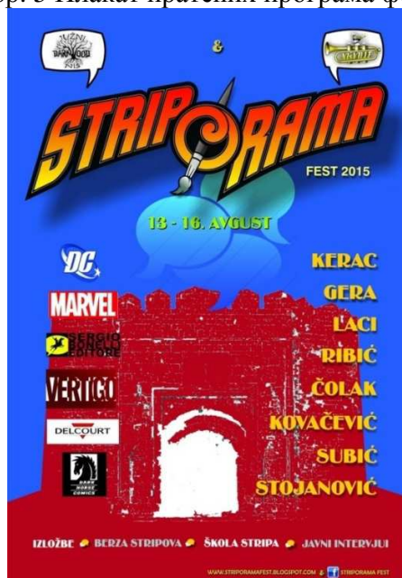
Слика бр. 5 Плакат пратећих програма фестивала