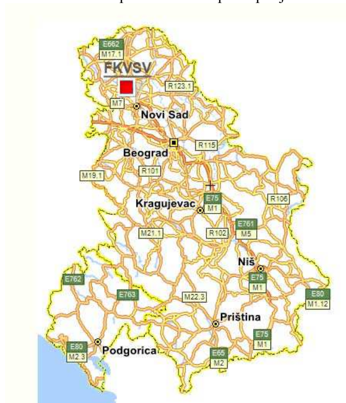
Слика бр. 1 Ниш на карти Србије