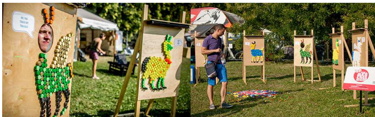
Slika 11. “Farma lama”