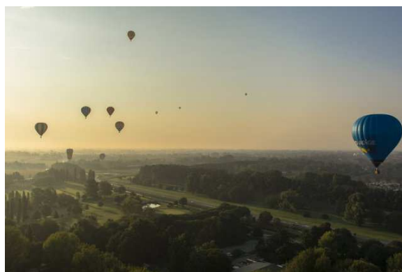
Slika 7.i 8. Urban park G.Basani za vreme festivala

Izvor: ( http://www.ferrarafestival.it/images/phocagallery/2014/concorsofoto/thumbs/phoca_thumb_l_bonesini-tatiana-mm1-gocce-d_aria-secondo-posto_ott.jpg )