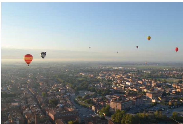
Slika 9. Let balona