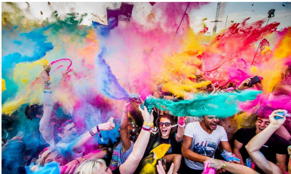
Slika 13. Deo atmosfere na glavnoj bini