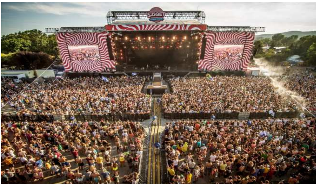
Slika 4. Sziget festival