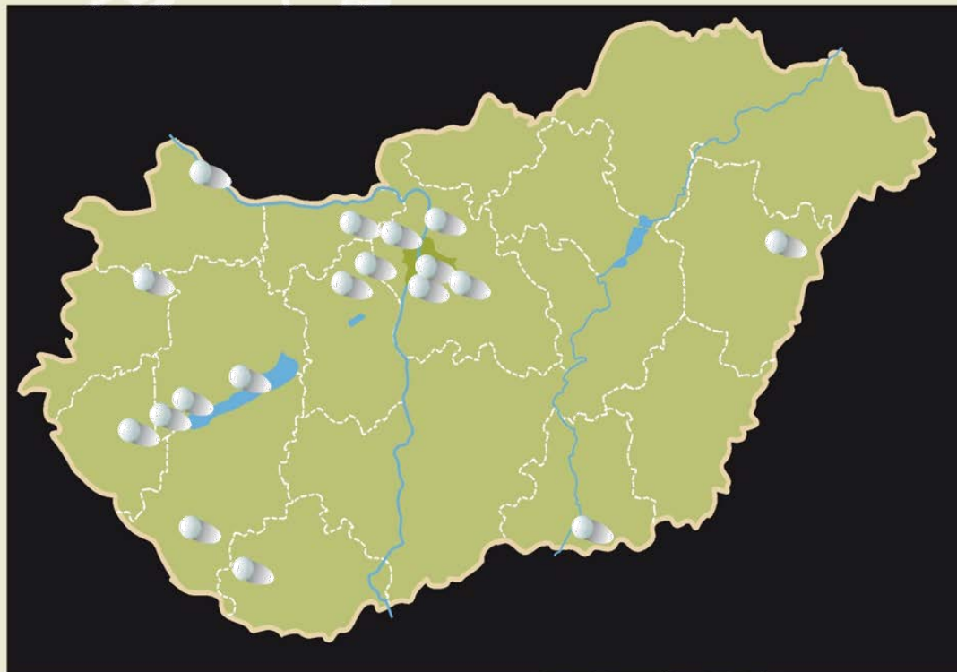
Položaj golf terena u Mađarskoj