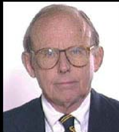
Samuel P. Huntington (1927-2008)