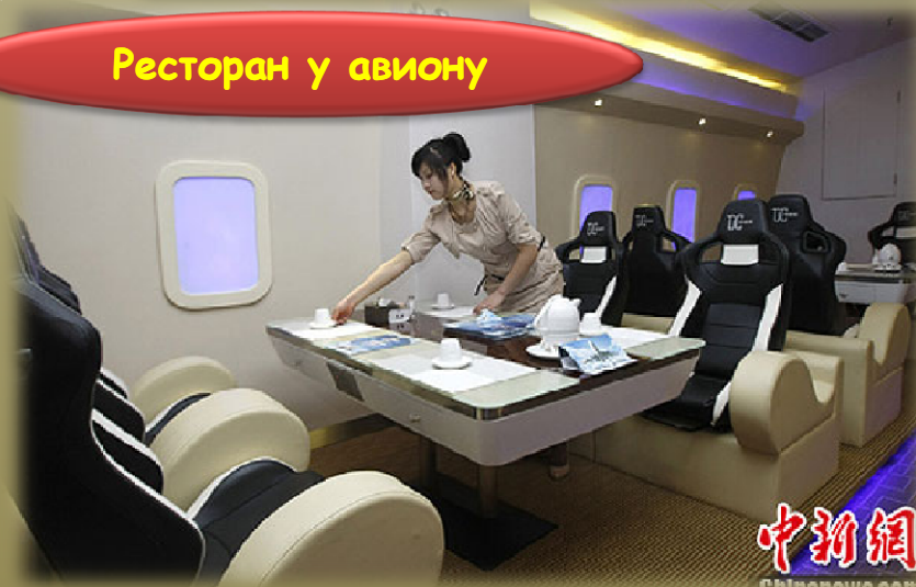
Ресторан у авиону