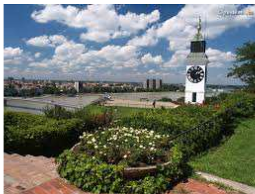
Slika 2. Petrovaradinski sat