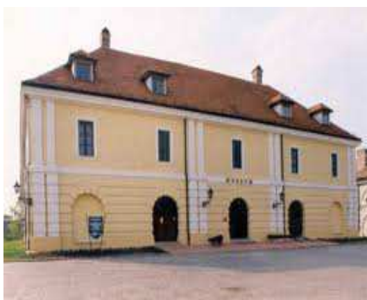
Slika 3. Muzej grada Novog Sada