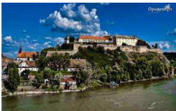
Slika 1. Petrovaradinska tvrđava

Povratak na plažu Štrand. Zatvaranje programa uz dodelu plaketa i zahvalnica.