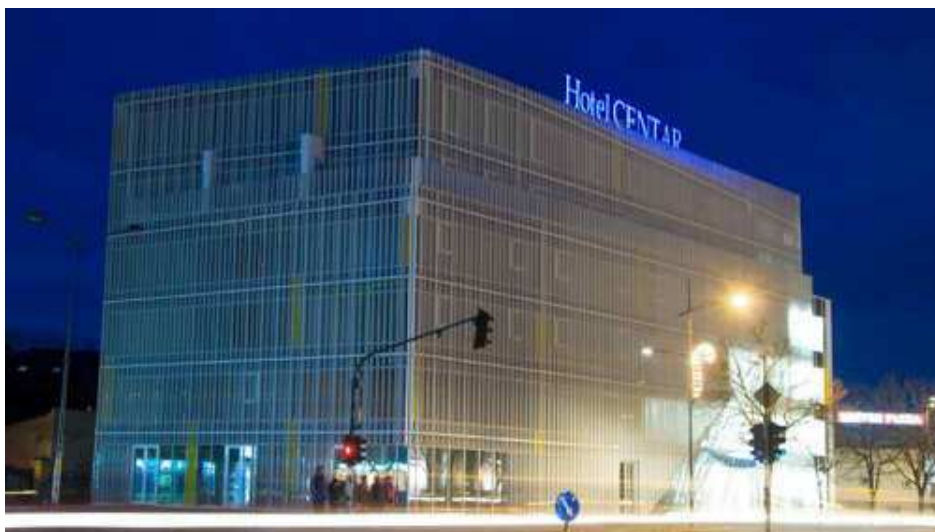
Slika 4. Hotel „Centar“

Kopiranje i slanje faksa: Ljubazno, efikasno i brzo osoblje na recepciji će Vam u svakom trenutku kopirati važne materijale ili proslediti faks.