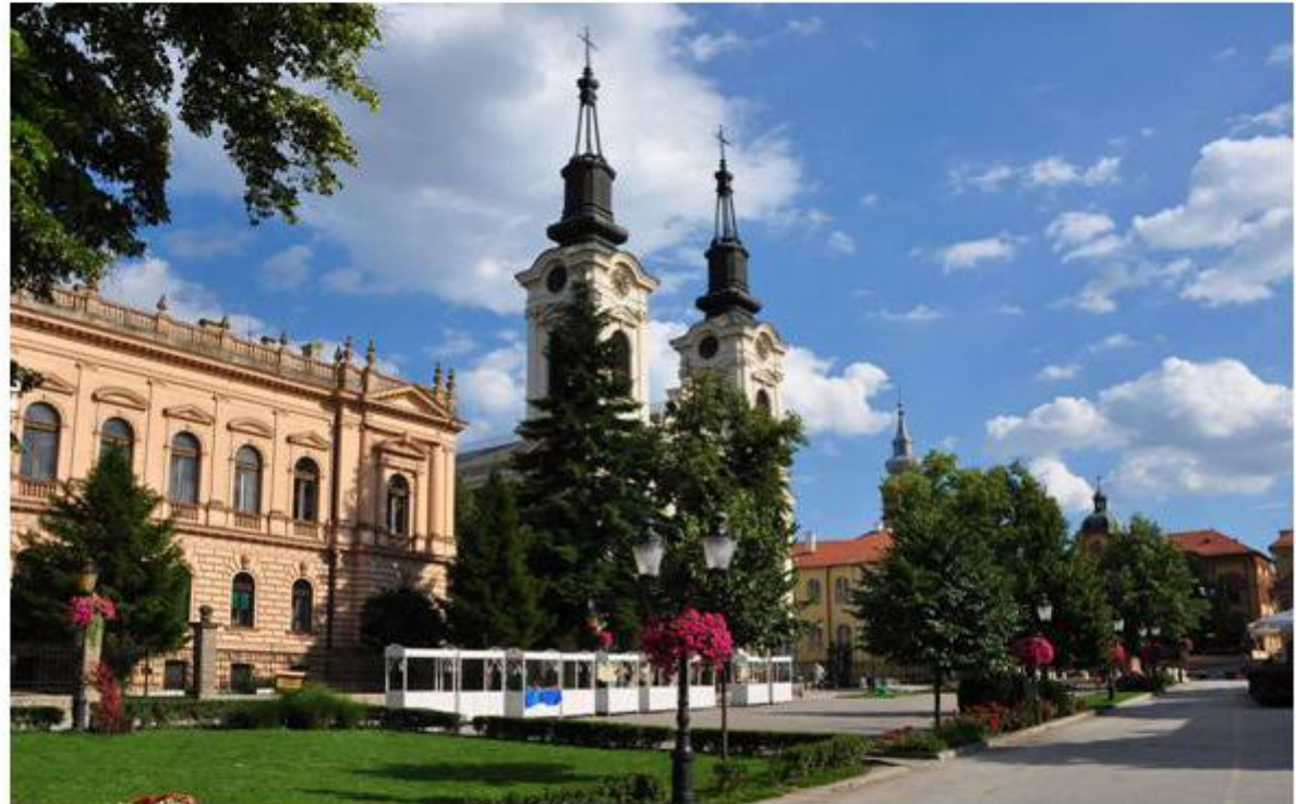
Slika 1. Centar Sremskih Karlovaca

Lorem ipsum dolor sit amet, consectetur adipisicing elit, sed do eiusmod tempor incididunt ut labore et dolore magna aliqua. Ut enim ad minim veniam, quis nostrud exercitation ullamco laboris nisi ut aliquip ex ea commodo consequat. Duis aute irure dolor in reprehenderit in voluptate velit esse cillum dolore eu fugiat nulla pariatur. Excepteur sint occaecat cupidatat non proident, sunt in culpa qui officia deserunt mollit anim id est laborum.