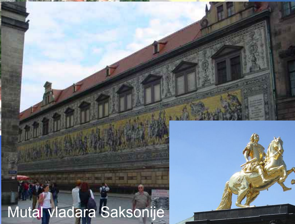
Mural vladara Saksonije