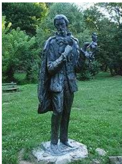
Статуа Бранка Радичевића

Данас је Стражилово једно од најважнијих станица приликом туристичких посета Сремским Карловцима. Оно је, такође, део Националног парка Фрушка гора. Овде постоји и одмаралиште „Бранков Чардак“ са рестораном и бунгаловима за дужи боравак.