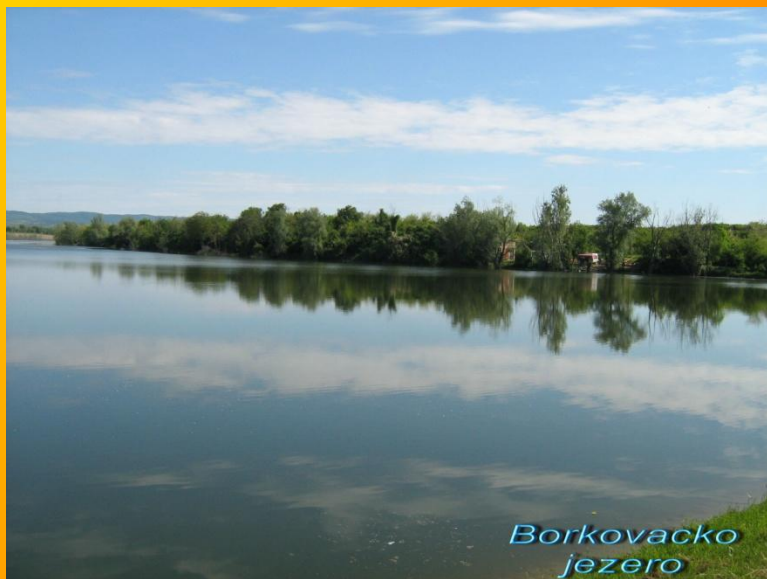
Slika 1: Jezero Borkovac