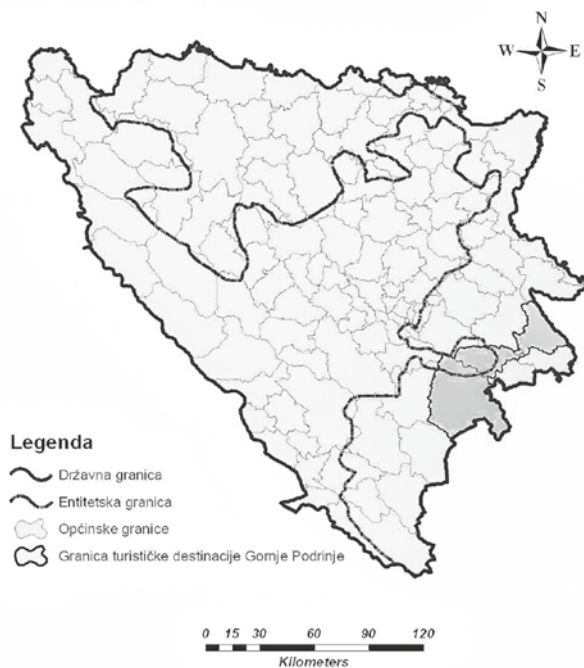
Карта 1. Географски положај туристичке дестинације Горњег Подриња Map 1. The geographical position of the tourist destinations of the Upper Drina valley

Стога туристичку регионализацију не треба поистовећивати са регионализмом, тј. туристичке регије, односно дестинације се не морају поклапати са географским регионима. Према томе, туристичка дестинација Горње Подриње