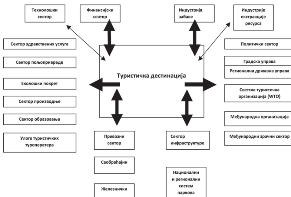
Шема 3. Везе између туризма и осталих сектора економије у друштву

Scheme 3. Relation between tourism and other sectors of economy and society