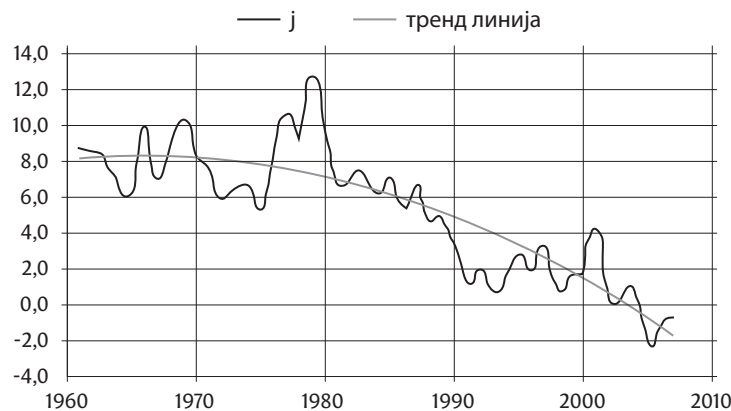
Графикон 3. Стопа природног прираштаја у Каћу, 1961-2007.

Chart 3 – Natural increase rates in Kać, 1961-2007.