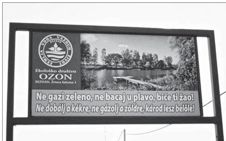
Слика 5. Еколошка табла ( www.bezdan.org.yu )

Photo 5. Ecological board ( www.bezdan.org.yu )