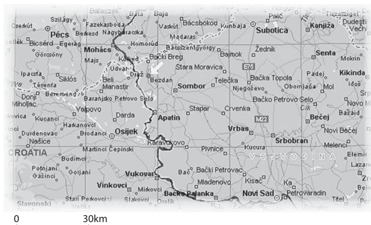
Карта 1. Географски положај Бездана Map 1. Geographical position of Bezdan

Удаљен је 10 км од границе са Мађарском, 6 км од хрватске границе и Дунава, и 18 км од Сомбора. Због водених токова који га окружују, популарно се назива водено насеље (карта 1). Из Бездана на путу према Сомбору, прелази се преко моста на речици Плазовић, према суседном селу Бачки Моноштор неизбежан је Велики Бачки канал, а према такође суседном селу Колут налази се водени ток Бели Јарак. Из Бездана полази Велики бачки канал (Бездан-Бечеј), и Канал Дунав-Тиса-Дунав, док се Бајски канал, који долази из Баје (Мађарска), ту завршава. Налази се у околини Специјалног резервата природе „Горње Подунавље“ са изузетним заштићеним екосистемима. Један од дозвољених начина коришћења оваквих екосистема је и њихово туристичко коришћење.