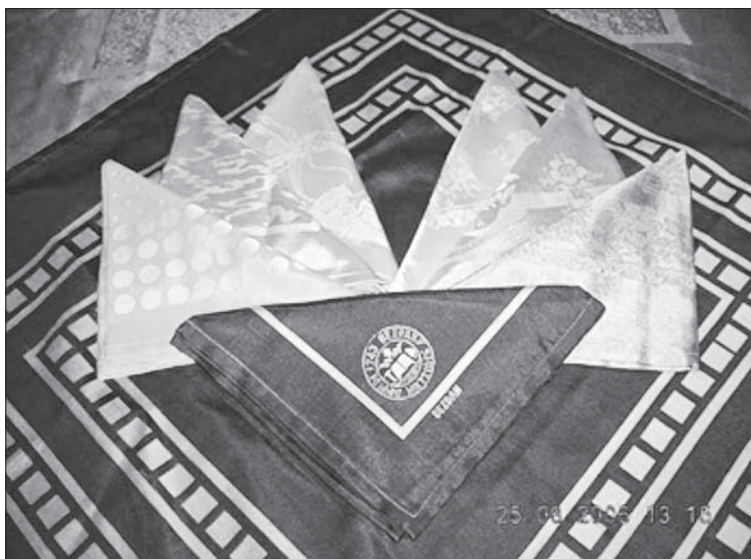
Слика 4. Производи од свиленог дамаста

Photo 4. Souvenirs made of silk damast