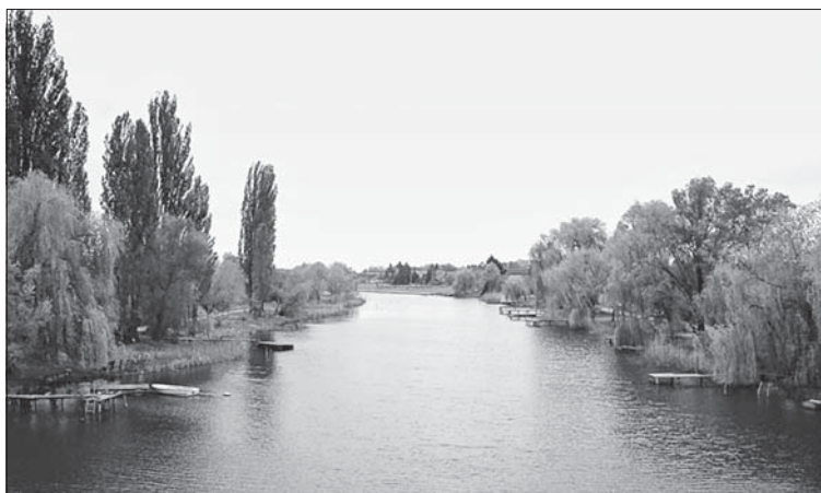
Слика 2. Велики бачки канал у Бездану Photo 2. Great Backa channel

Бајски канал се протеже паралелно са Дунавом, од Баје до Великог бачког канала, са којим је спојен преко преводнице и уставе Шебеш Фок. Изграђен је у периоду од 1872. до 1875. године са циљем напајања Великог бачког канала водом, када се то није могло изводити преко безданске уставе (Божић, 1998).