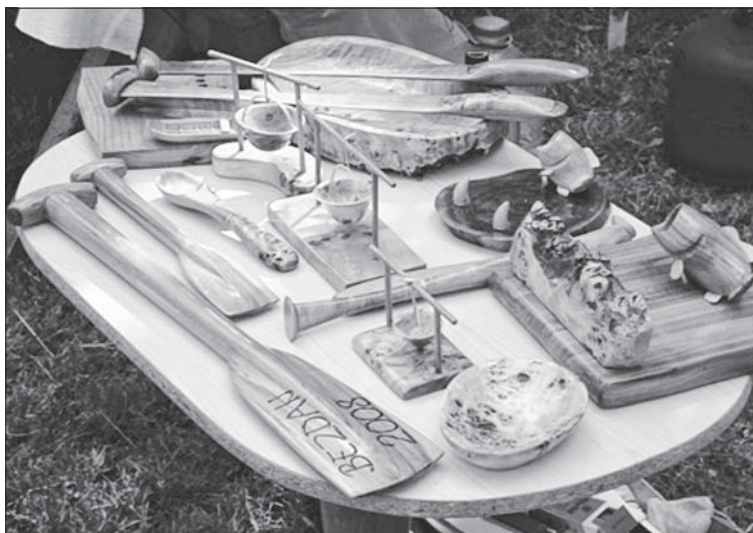
Слика 7. Рукотворине од дрвета Photo 7. Handicrafts made of wood

Графичка средства попут проспеката као што су брошуре, израђене су у циљу промовисања туристичке и угоститељске понуде у Бездану. Постоје и календари разних фирми који кроз слике приказују Бездан. Међутим, потребно је укључити сву постојећу туристичку понуду у израду брошура које би се нашле у рукама потенцијалних туриста. Публицистичка издања попут различитих чланака, репортажа, часописа и новина омогућила би још већу заинтересованост посетилаца. Израда фо-