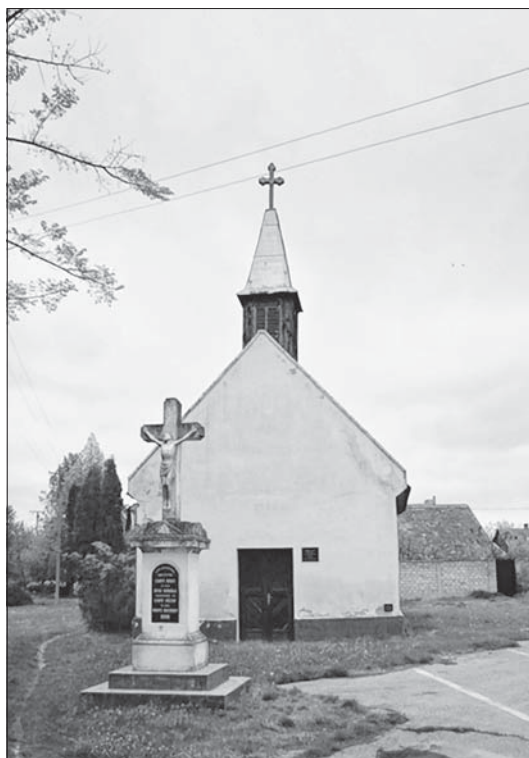
Слика 3. Капела Свете Тројице

Photo 3. Chapel of St. Triple