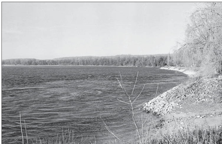
Слика 1. Дунав код Бездана Photo 1. River Danube near Bezdan

Канал Бездан – Пригревица протиче у дужини од 18 км. Он представља напајајући крак система Дунав –Тиса –Дунав, водом из уставе код Бездана.